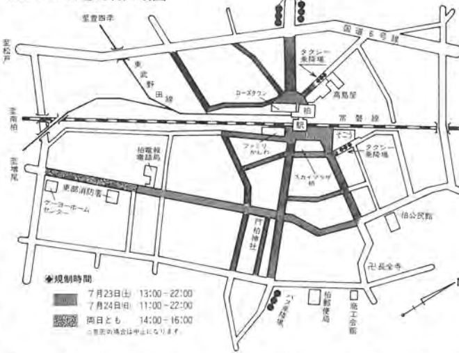
柏まつり交通規制区域図

十分(注意)ください。なお、柏まつり実行委員会では「まつりへの参加や見物には、車や自転車の利用を避け、駅前の自転車の放置もしない」を呼びかけています。問い合わせ 柏まつり実行委員会事務局 67-119-1191