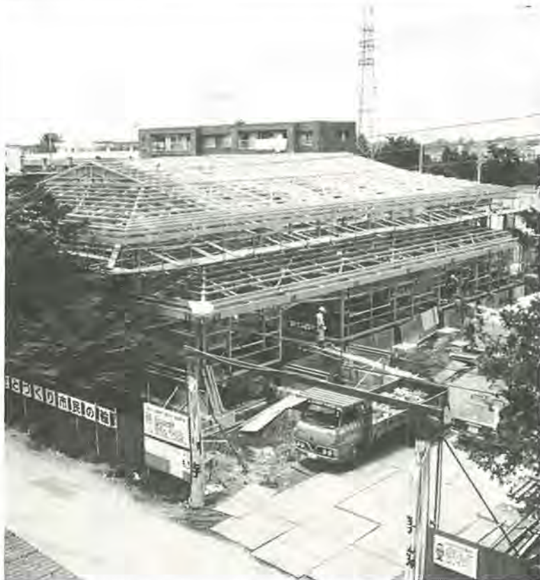
8月末の工事完成目指し、急ピッチに工事が進む根戸近隣センター