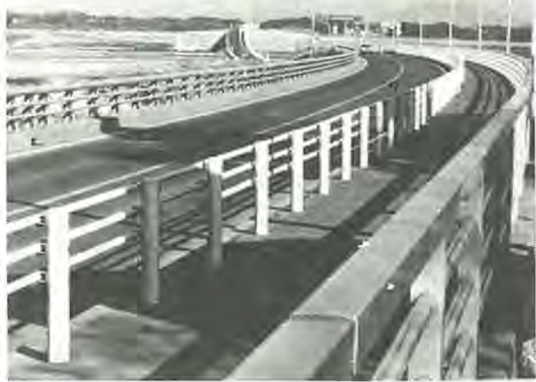
《第3回ふるさと柏写真展から》 作品はカラー

町、今谷上町、永楽台一～三丁目、大塚町、柏一～七丁目、柏下、亀甲台町一～二丁目、桜台、新富町一丁目、関陽町、中央一～二丁目、千代田一～三丁目、常盤台、戸張、富里一～三丁目、豊上町、豊住一～四・五丁目、中原、各戸ヶ谷一丁目、八幡町、ひばりが丘、日立台一～二丁目、緑ヶ丘、南柏一～二丁目、弥生町、豊町一～二丁目、吉野沢、若葉町、豊四季の一部