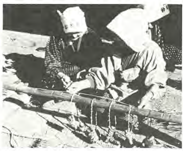
《第3回ふるさと柏写真展から》 作品はカラー

〇対象 昭和52年4月2日から同53年4月1日までに生まれた乳幼児をお持ちの親 〇費用 無料 〇申し込み はがきに「通信幼児家庭教育学級希望」と書き、住所、保護者名、幼児の氏名・生年月日、電話番号、受講希望の理由を明記して、6月末日までに、〒277 柏市柏五丁目一〇一 柏市教育委員会社会教育課へ郵送を。〇問い合わせ 社会教育課へ。 〇対象 昭和52年4月2日から同53年4月1日までに生まれた乳幼児をお持ちの親 〇費用 無料 〇申し込み はがきに「通信幼児家庭教育学級希望」と書き、住所、保護者名、幼児の氏名・生年月日、電話番号、受講希望の理由を明記して、6月末日までに、〒277 柏市柏五丁目一〇一 柏市教育委員会社会教育課へ郵送を。〇問い合わせ 社会教育課へ。