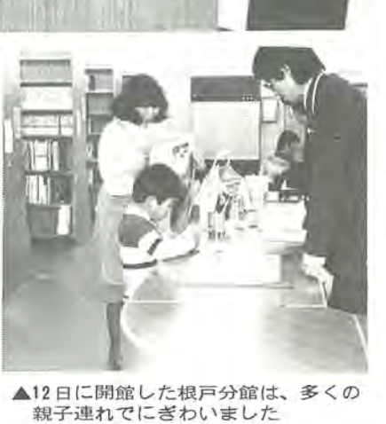
▲12日に開館した根戸分館は、多くの親子連れでにぎわいました