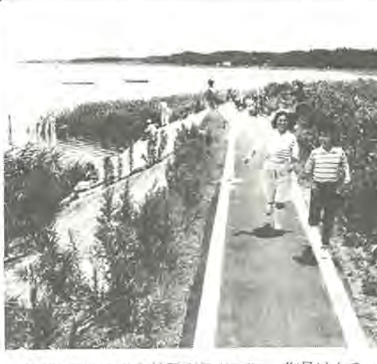
《第3回ふるさと柏写真展から》 作品はカラー