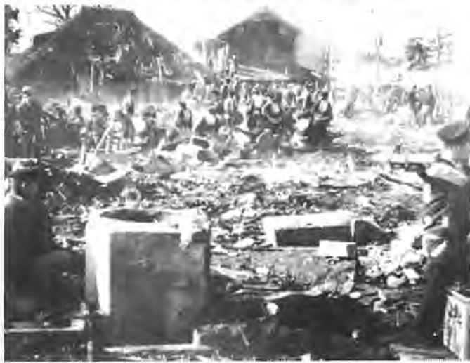
大火から一夜明けた被災の現場

一枚の写真から 「柏の大火」 きょうから師走。火の気の恋しい時節となりました。あす二日までは、「火の用心、火の用心、目で用心」をスローガンにした、秋の全国火災予防運動も行われています。