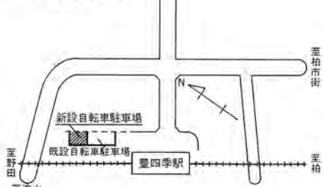
■豊四季駅自転車駐車場案内図

市内二十カ所目の自転車駐車場が豊四季駅前完成し、十二月一日から無料で開放します。利用ください。この自転車駐車場は、現在同駅前にある自転車駐車場の隣りに整備が進められていたもので、面積約七百七十平方メートル、アスファルト舗装で夜間照明が付けられています。この自転車駐車場の完成により、豊四季駅前広場と駅前通りの自転車等の放置は禁止されますので市民の皆様のご協力をお願いいたします。 柏市内の各駅周辺に放置されている自転車等は、約六千九百台。今年九月調査にも上り、街の美観を損ねるばかりでなく、通行する歩行者や車の障害となり、自転車公害とまで言われるようになった。十二月一日に東武野田線豊四季駅前に、市内二十カ所目の自転車駐車場(別図)が完成し使えるようになります。この自転車駐車場は、東武鉄道から約七十平方メートルの土地を無償で借り受け、アスファルト舗装や夜間照明などの整備をしたもの。同駐車場の完成により、豊四季駅前通りへの自転車等の放置は禁止となります。また現在この付近に長期開放してある自転車等を十二月一日に撤去します。 しかし、同駅周辺には、自転車、バイク等を除き通