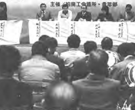
放置自転車について真剣に議論されました