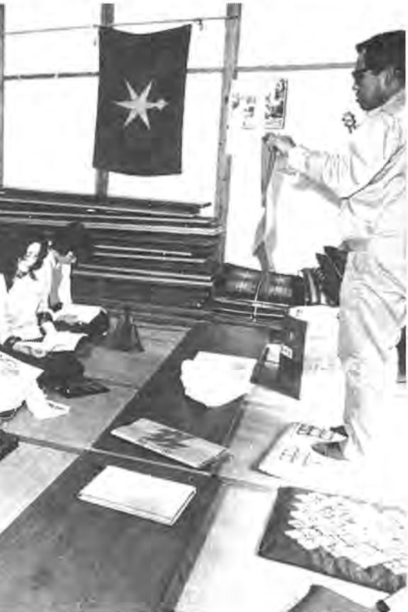
ゴミ減量の説明会で市職員の説明に熱心に聞き入る主婦のみなさん(松ヶ崎青年館で)

高田川岸、松ヶ崎、松ヶ丘、寿町、香取台、梅林、熊の台、高田団地、東十余二、の二十四町会にも協力いただくことになりました。これらの町会では、すでに三分別排出や資源ゴミの回収についての説明会を行っていますので、ゴミの正しい出し方について十分注意して、ゴミ減量にご協力ください。