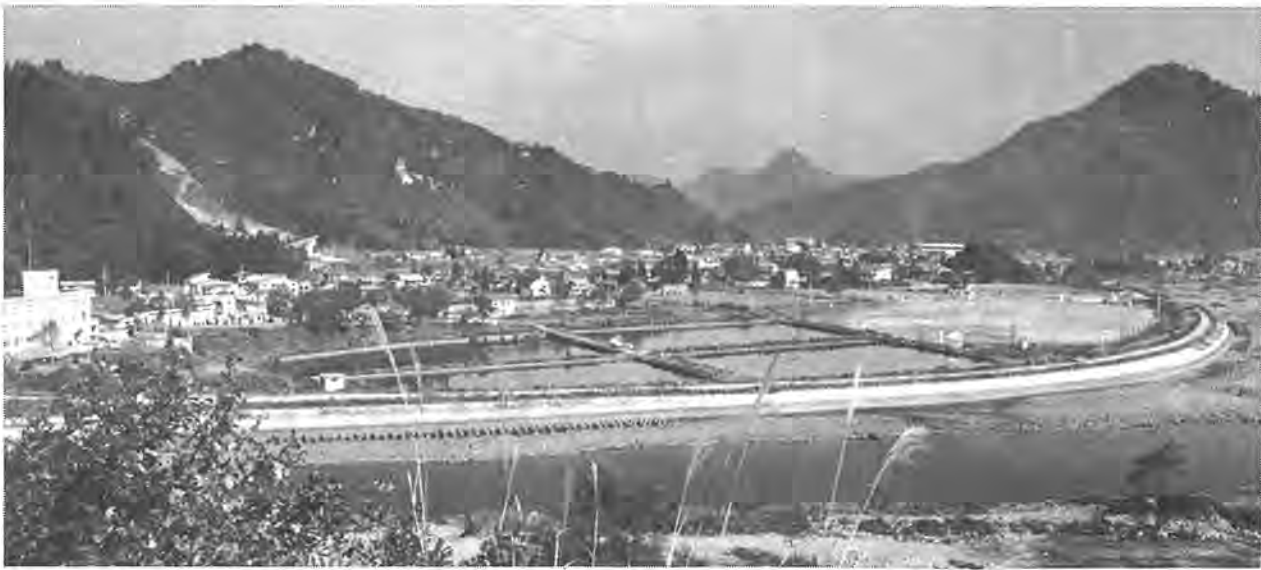
山と川に囲まれ静かなたたずまいの只見町

15日からダイヤ改正で十一月十五日に実施される国鉄秋のダイヤ改正で、常磐線の中距離電車四本が増発されることになりました。また、我孫子一取手間の複々線化に伴い、緩行線(千代田線)の朝夕の電車が一部取手発、取手行きとなります。