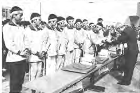
県教育功労者に四個人、一団体が受賞 十一月一日、千葉市の県教育会