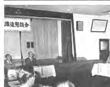
今後の交流について熱心な話し合いが行われた推進懇談会

永楽台地区の住民と、福島県南会津郡の只見町が「ふるさと交流」の緑結びをする事になり、その手始めとして十一月十三、十四日に、永楽台近隣センターで行われる同地区文化祭に「只見町コーナー」を設け、同町の民芸品の製作・展示・販売、山菜・野菜の展示・即売などを行うことになりました。