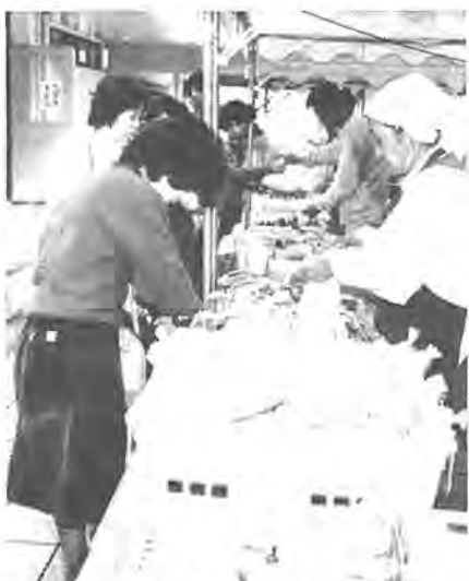
3回目を迎えるすっかり団地住民に定着した、里美村物産展

また、昭和五十五年からは、村の高齢者生産活動センターや農協が中心となり、団地の文化祭会場、村の農産物や特産品を展示即売する里美村物産展を開いていきます。第三回目を迎えた今年はお