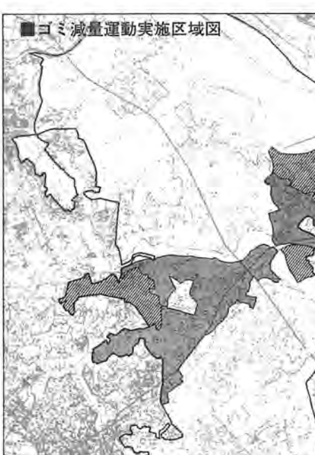
■ゴミ減量運動実施区域図 ●ゴミ減量運動実施中の地域 ■10月1日からゴミ減量にご協力いただく地域

最高6万円を貸し付け 私立幼稚園の入園資金に 私立幼稚園に子供さんを入園させたいが、入園時に多額の費用がかかると困るといふご両親に、今年から「柏市私立幼稚園入園資金貸付制度」がスタートします。この制度は、私立幼稚園に入園する幼児の保護者で、入園手続きの際に必要な入園金などの調達が困難な方を対象に、市が一人につき最高六万円を無利子で貸し付け、貸りた翌月から十九月の割賦均等償還をするというものです。 ○対象 ①一年前から引き続き柏市に住所があること②市税の滞納がないこと③身元の確実な連帯保証人一人がいること ④募集人員 百六十七人 ⑤申し込み十月十五日(金)まで ⑥学校教育課へ貸し付けの可否については日申し込み者全員に個人通知します。 ⑦貸し付け日 十一月二日 ⑧問い合わせ 教育委員会学校教育課 67-1-22内線四二五八。