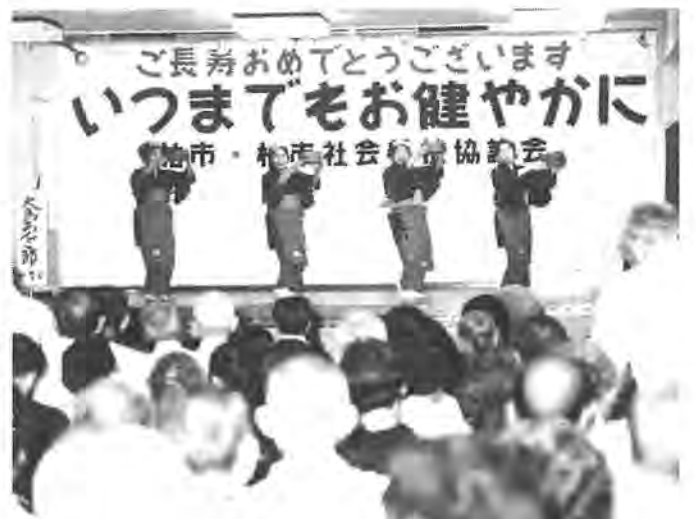
お年寄りの長寿と社会への貢献を感謝する敬老会 ＝昨年南部近隣センターで

九月十五日の「敬老の日」から老人福祉週間が始まります。この週間は、お年寄りが長寿の間、社会に貢献されてきたことへの感謝と、長寿を祝福して市では次のような行事を催します。