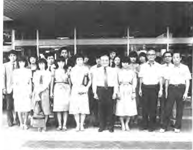
出発を前に市役所玄関前で市長（中央）といっしょに記念撮影

半は、長雨と台風にみまわれ、海や山など遠出をあてこんでいたデビツ子は、名残惜しみに毎日過ごしているのではないのでしょうか。またこのころはねじりはちまきをして、休み中の学習にラストスパートをかけている熱い子供たちもいることでしょう。残り少ない夏休みに、遠くへ行かなくても、あなたの身近な所で思い出を作ることが出来ます。ここでは、市内北東部にある布施の行楽地をセットにしてご紹介。まだまだ残暑が続きます。外出はくれぐれも帽子を忘れずに。