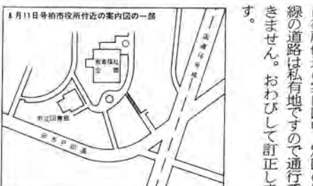
8月11日号柏市役所付近の案内図の一部

【訂正】八月十一日号四面の柏市役所付近の案内図中、別図の斜線の道路は私有地ですので通行できません。おわびして訂正します。