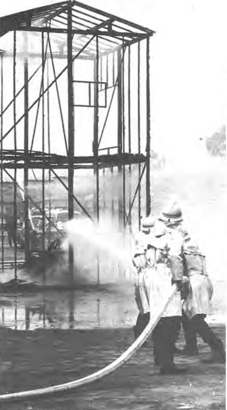
地震の時に恐ろしいのは、二次災害の火災。もしもの時にはまず火の始末を＝昨年の総合防災訓練から

今年の三月、北海道の浦河町で震度6の烈震を記録する「昭和五十七年浦河沖地震」が発生しました。 ② 日ごろから排水溝の清掃を 排水溝にゴミやビニールなどがつまっていると、少しの雨でも水があふれ、道路や家屋の浸水につながります。日ごろから自宅付近の排水溝の清掃を心掛けてください。 ③ 台風時には窓の補強を 強い風などで窓ガラスが割れないよう外側からガムテープなどで補強を。もし割れた場合に備えて厚手のカーテンを引いておくこと内側への散乱を防げます。