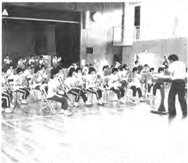
蒸し暑い体育館の中で、一心に指揮棒を見つめ練習に励む市立柏高校吹奏楽部のみなさん