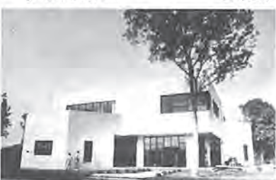
農業研修センター(写真)、中小企業融資の預託金など=11億4,508万円

昭和56年4月に策定した新総合計画では、施策を課題別に、7本の柱に分けています。そこで、56年度下期の事業をこれに沿ってみると、次のようになります。総額は173億5,029万円となっています。