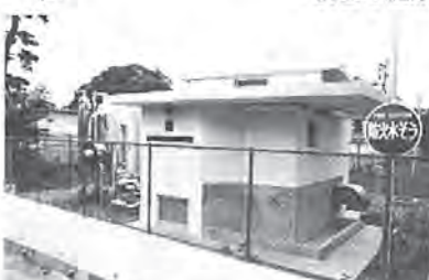
防災施設(写真=耐震性の飲料水供給装置)、交通安全施設など=7億5,772万円