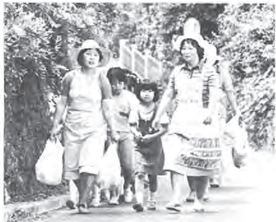
家族そろって「クリーンピクニック」も行われました—布施で