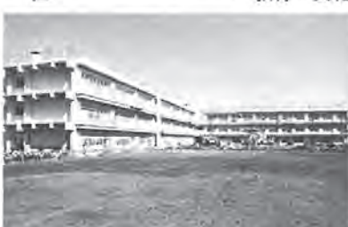
小中学校(写真=花野井小)、体育施設、図書館など=43億3,460万円