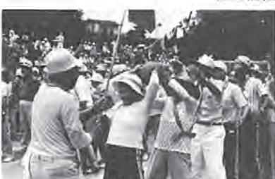
老人福祉事業(写真=シルバー運動会)、障害者福祉都市推進事業など=29億3,399万円