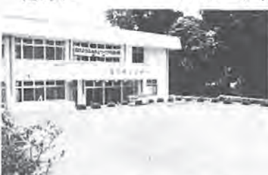
近隣センター(写真=新富近隣センター)、など=10億6,766万円