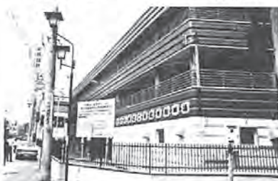
柏駅西口自転車駐車場(写真)、増尾城址(公園)など=18億8,281万円