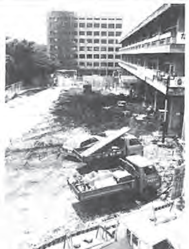
現庁舎前の外構工事。正面の建物が新庁舎高層棟—4月5日

五十六年一月から進めている市役所の庁舎増築工事は、いよいよ大詰めとなり、今年五月末日までに全体の八八%まで進みました。現在、増築庁舎は高層棟、低層棟とも一階部分を残して外装はほぼ終わり、内装工事に取りかかっています。これと同時に現庁舎前の外構工事も進めています。