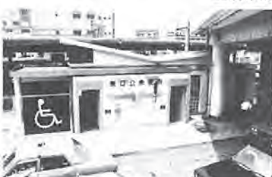
柏駅東口公衆便所(写真)、市営住宅など=52億2,843万円