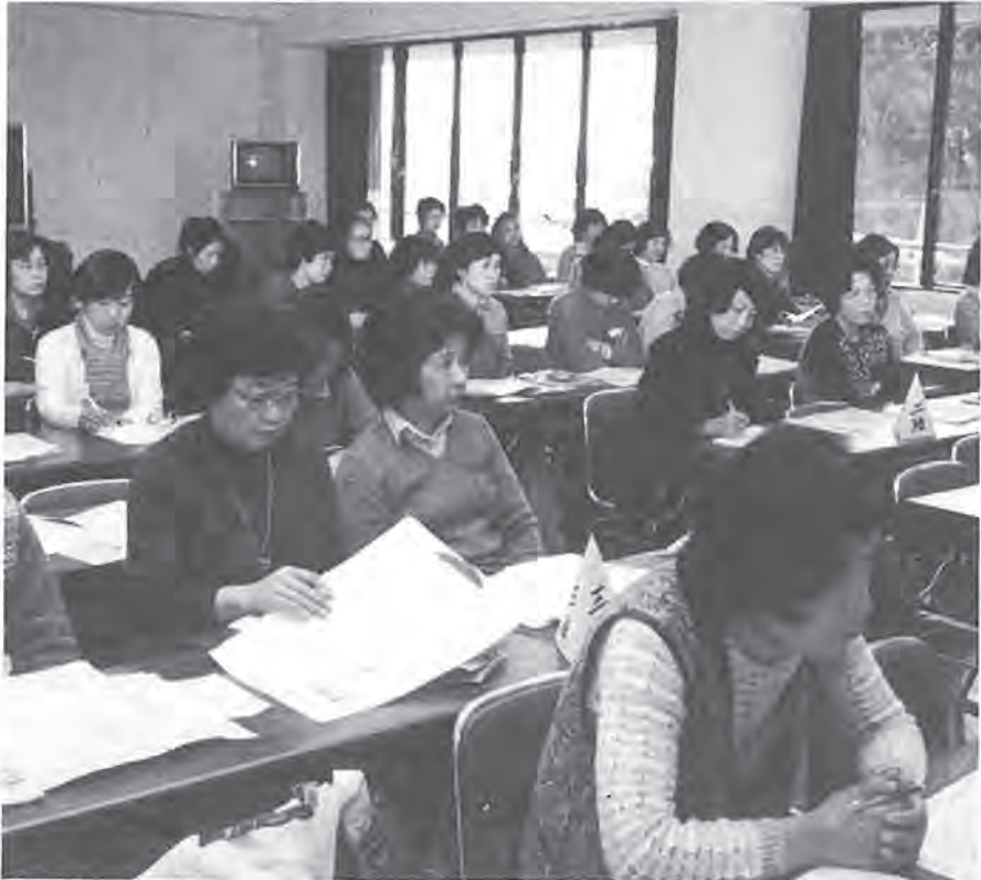
真剣なまなざしで講義を受ける婦人大学のみなさん—昨年の一年次教養課程で

これは、昨年十二月以来「契約 事務検討委員会」を設置して、業 者の選定や入札などについて種々 の検討を行った結果、実施するこ とになったものです。 実施される入札結果の公表等は 次のとおり。 ①建設工事の指名業者数の基準 は十社とする②予定価格五百万円 以上の建設工事について指名業者 名、工事の名称と施工場所、入札 結果とその経過を公表する③公表 の方法は入札結果閲覧簿による閱 覧とし、その場所は契約担当課、 閲覧の期間は入札日の属する会計 年度中とするなど。また、予定 価格九千万円以上の建設工事は、 第一回の入札時に積算内訳書の提 出が義務づけられています。