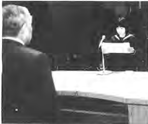
誓いのことばを述べる就職生徒の代表