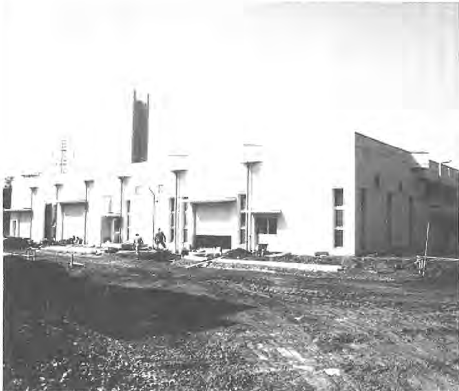
現在、増設工事が進められている第2し尿処理場

昭和五十七年第一回定例市議会が、三月五日から同二十六日までの二十二日間の会期で開かれています。この議会では、昭和五十七年度の予算案(一般会計予算三百九十億五千五百万円、水道事業を含む特別会計予算百二十九億一千二百六十万円)をはじめ、四市結核予防組合からの脱退、柏市視聴覚ライブラリー設置条例の制定、柏市非常勤特別職員の報酬及び費用弁償の一部条例改正、柏市職員定数条例の一部改正など、三十五議案が審議されています。今号では、この三月議案に提出された議案のうち主なものを簡単に紹介します。