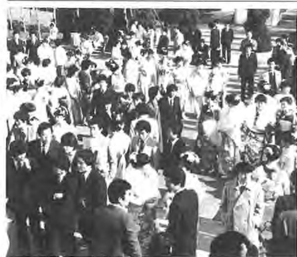
春の日を浴びながら旧友との話がはずむ新成人たち

一月十四日、柏中学校校庭で消防職員、消防団員五百五十六人と消防車両四十七台が参加して、昭和五十七年消防出初め式が行われ、柏の消防力を披露しました。消防旗の入場で幕を開けた式は、服装点検、小隊教練、ポンプ操法とまきびき進められ、特別救助隊による救助訓練には、見学にきていた幼稚園児のかわいい声援が飛んでいました。また、同式では、千葉県知事表彰や柏市長表彰、感謝状の授与などが行われ、百三十七人が表彰されました。消防本部では「これから寒さが厳しくなります。今年に入ってから六件の火災が起きています。各ご家庭においても十分火の取り扱いに注意して火事を起こさないように」と呼びかけています。