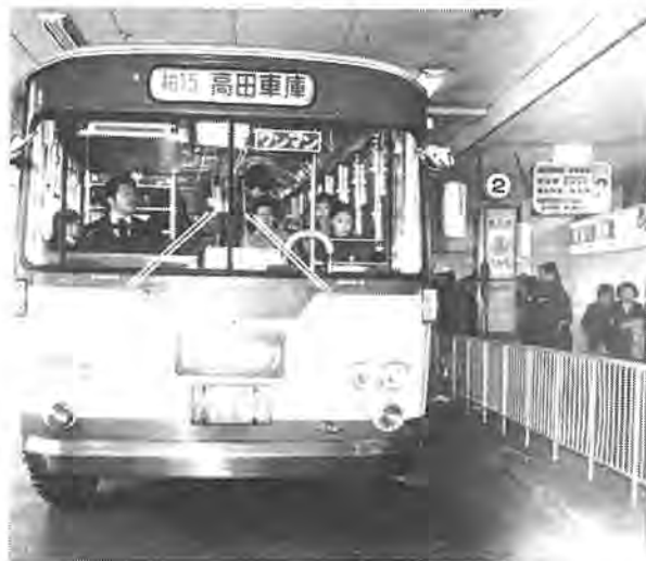
バス増発により通勤・通学や買い物の足も便利に

平日の上り高田車庫発の始発が午前七時六分、同六時四十八分に繰り上げられたほか、下り柏駅西口発の終発は午後八時二十一分から同九時三十五分に繰り下げられるなど、通勤・通学者にとって便利になりました。また、昼間は各時間帯でほぼ一本ずつ増発され、買い物客にとっても利用しやすくなりました。