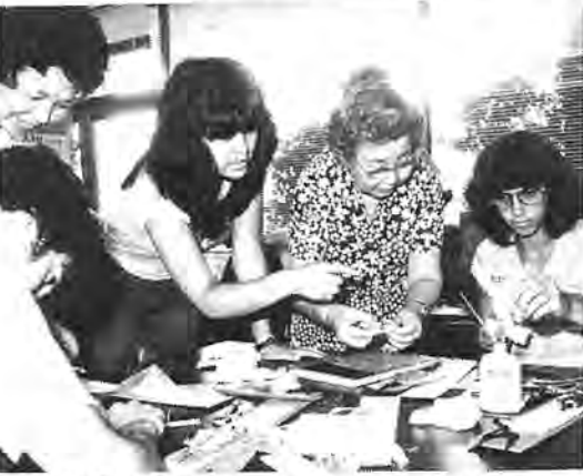
器用な手先で、紙人形を作りあげました

豊四季分館 45-9546 おはなし会 7日(金)、21日(金) 午後3時半～同4時