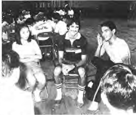
ト市学生を交えて、なごやかにグループミーティング