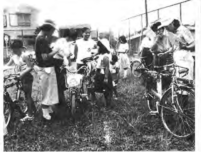
子供たちの夏休みを前に行われた自転車点検＝7月18日千代田町公園わきの広場で