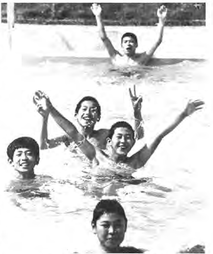
明るく元気な子供たち＝市民プールで

あなたはなんでもわかり合える友達がいまいるかとの問いに対し、「いい」と答えたのは、中学生八一％、高校生八三％、「いいない」と答えたのは、中学生二六％、高校生二四％となっています。