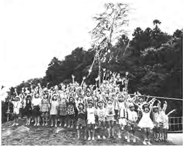
みんなで作った七夕飾りに歓声をあげる園児たち