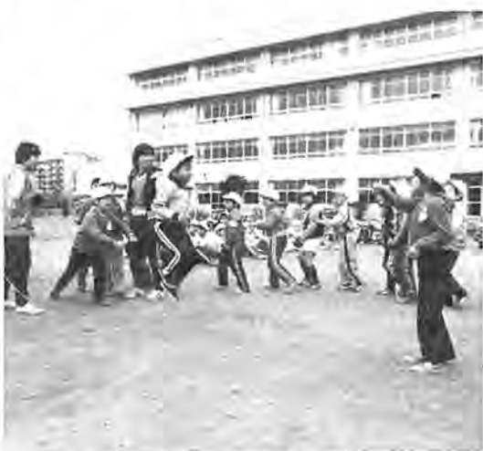
大きな掛け声に合わせて、リズムカルになわを飛び越える児童たち

月七日に酒井根西小(入江藩)校長、児童数七百八十一人で行われた「長なわとび大会」の一コマ。 学級応援旗を振りかざし、クラスの仲間には大きな声援が送ら