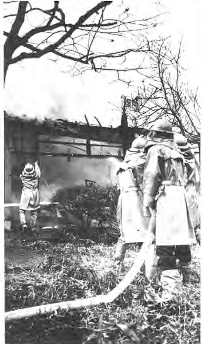
大切な財産や生命を守るためにも、ふだんの防火に対する心がけが大事です

立春も過ぎ、暦の上ではもう春。しかし、春とはいってもこの季節は、朝夕の冷え込みも厳しく、強風が吹いたり、空気が乾燥するために、物々燃えやすくなります。このため、火災の発生件数が年間を通して最も多く、火災のシーズンともいわれています。そこで、「あなただです、火事を出すのも防ぐのも」をスローガンに、二月二十八日から三月十三日までの二週間にかけて、春の火災予防運動が展開されます。この運動は、市民一人ひとりが防火意識を持ち、火災発生防止と火災による悲惨な焼死事故や、財産を守つていただくことを目的としています。市民の皆さんもこの運動を機会に、火災予防について、家族で話し合ってみてはいかがでしょうか。