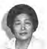
岡田 やぶ 明原3-13-11 番45-2246