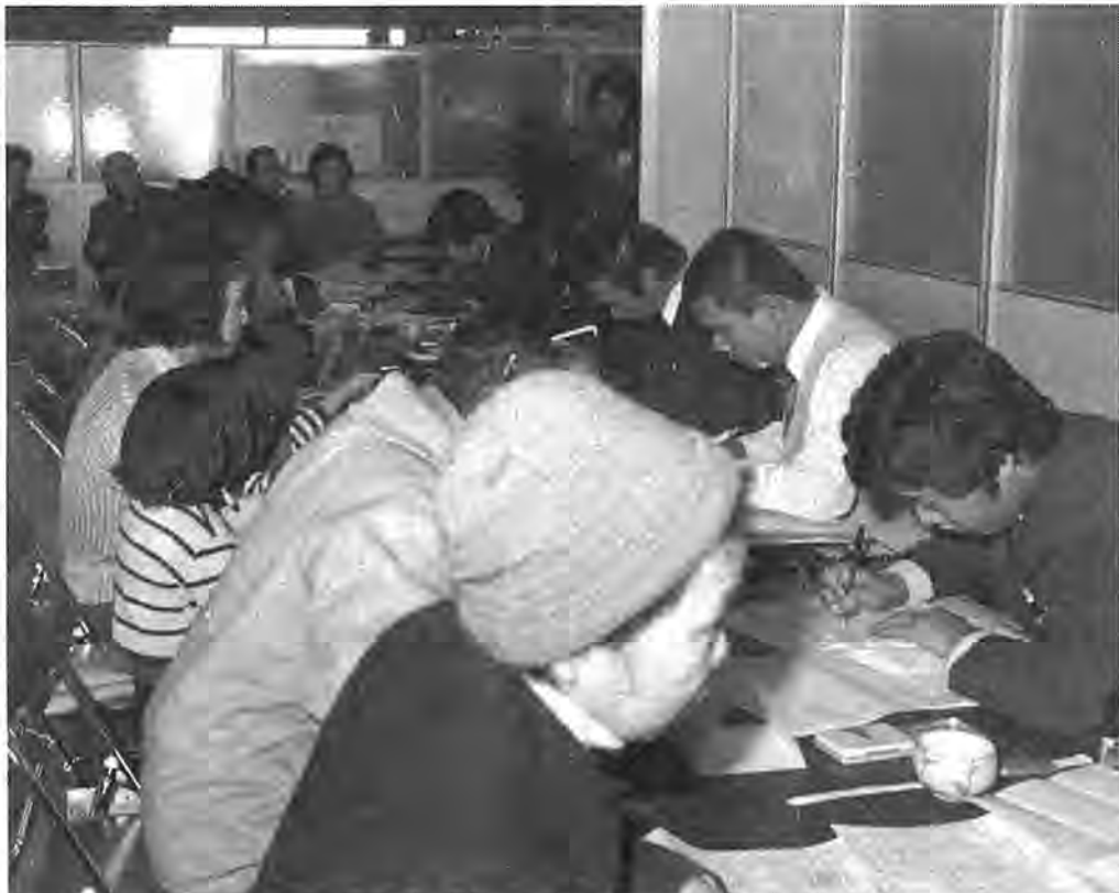
適正な税を納めようと申告会場を訪れる納税者たち (市役所での申告風景—昨年写す)

昭和五十六年一月一日現在、柏市、譲渡などで所得のあった方。ら給与(恩給、年金など)を受けている方。次に該当する方は、必ず申告を。 ① 営業、農業などの事業を営んでいる方や地代、家賃、配当、利 ② 給与所得者で、給与のほかに地代、家賃、利子、配当、原稿料などの所得のあった方。 ③ 給与所得者で、二方以上が屋敷を持っている方も申告をして