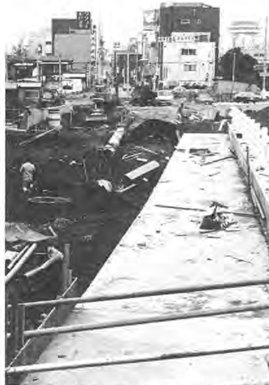
歩道の一部がお目見えした「柏駅前線」の工事

柏駅東口から伸びる都市計画道路「柏駅前線」の貫通工事と同「柏駅小堤台線」の改良工事が三月までには終わる予定となり、柏駅東口市街地の交通が大きく改善されることになりました。「柏駅前線」は未開通部分の工事が行われているもので、全面開通すると、増尾、沼南町方面への幹線道路になります。また「柏駅小堤台線」のほうは旧水戸街道との交差点などを改良。これで車両の流れがスムーズになると同時に、歩道が新設されることで歩行者の安全も確保されることになりました。