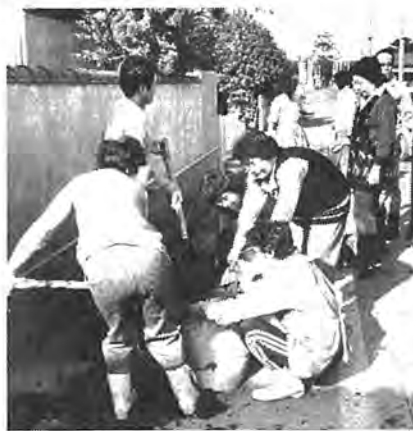
▲ 11月9日『ふるさとクリーン・デー』が行われ、町会、子供会、商店会などの積極的な市民参加が見られました。写真＝豊町で

◀ 手軽な市民の足として急速に普及した自転車。しかし、駅周辺の放置自転車大きな社会問題となっています。市では、駐車場の設置やゴミ化した自転車の撤去などを行っています。問題の解決には利用する市民の協力が必要です。写真＝11月に行われた撤去作業