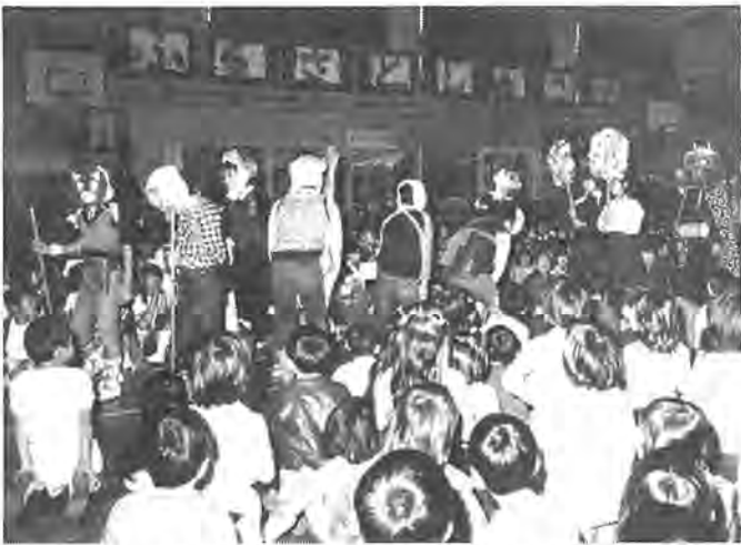
獅子や動物のお面などすべて児童の手作りです

当日は、各学年の児童が十月から積極的に取り組んだ、柏踊りやみこし、作文の朗読、柏二小が誕生する以前の古い昔の様子を紹介する劇など練習の成果を披露しました。中でも、藤籠田に伝わる三匹獅子舞は、地元獅子舞保存会の皆さんの協力をえ