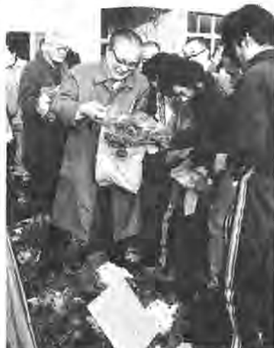
老人大学校の皆さんの人気を得た葉ボタンの即売会=12月9日青和園で

市内十余二にある市の福祉施設「青和園」では、園生が丹精をこめて育てた葉ボタンなどの出張即売会を、十二月二十二日午後一時から同三時、豊四季台近隣センターで行います。 同園は、十二月二十五日から冬休みに入るため、この即売会は今