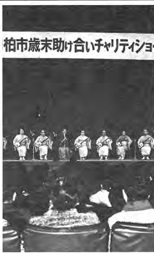
柏市文化連盟有志による三味線の合奏

に愛の手を、をスローガンに、柏市社会福祉協議会の主催により、歳末助け合い募金運動の一環として毎年行っているものです。 ショーは、正午から始められ、柏市文化連盟の有志による民謡、舞踊を皮切りに、第一部「民謡・ふるさとの歌」、第二部「舞踊・青雲に黄菊白菊舞い初めり」、第三部「民謡・おほい集」と続き、ステージで繰り広げられる、歌や踊り、漫才に時のたつのも忘れるほどでした。