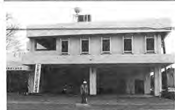
大室分署の完成で北部地域の消防、救急力が大幅に充実されました

これらの通学区区域は、過大校の現状と地域の将来性、通学距離や交通状況等を考慮して案を作成、数回にわたる地元説明会で意見を聴取した上で通学区区域審議会に諮問、その答申を得て教育委員会議で決められたものです。 来年四月から改築工事を進めていた西部消防署の大室分署が十二月二十日に完成、新庁舎で業務を開始しました。 これまで同分署は、市役所田中出張所(現在田中近隣センターに併設)と同じ敷地内で業務を行っていましたが、建物の延べ面積は約百三十二平方メートルと非常に狭く、施設の老朽化も進んでいました。今度改築された大室分署は、田中出張所があった跡地と、これまで