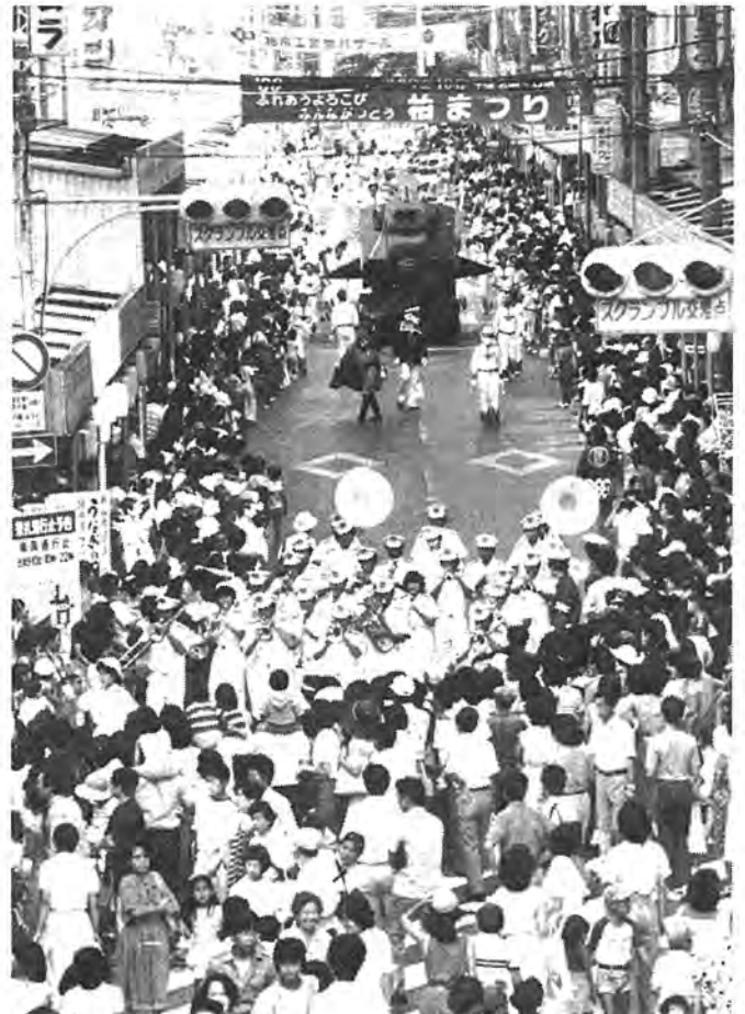
▲ 8月9日、10日の二日間『柏まつり』が盛大に繰り広げられました。今年初めての試みとして7月20日からの地区まつりや歌うミス柏コンテストが行われ、多くの市民が参加しました。商業まつりから衣がえして三年目を迎えた柏まつりは、新しいふるさとのまつりとして市民の間に定着してきたようです。写真＝柏駅前通りでのミュージックパレード