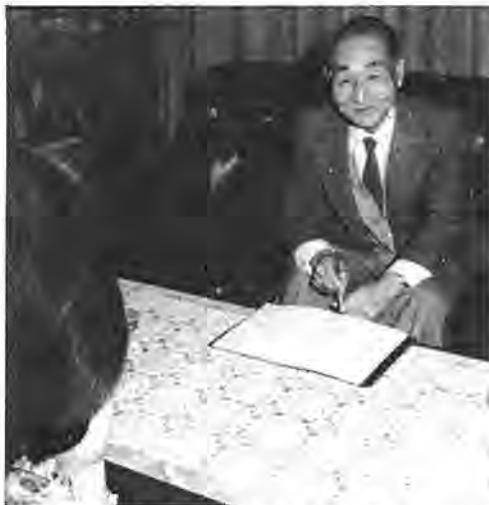
市民の話に耳を傾ける民生委員