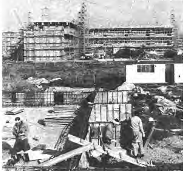
来春開校する北柏団地内の松葉中学校

昭和五十五年の第四回定例市議会は、十二月五日から同十九日までの予定で開かれています。今議会では、市庁舎増築工事の請負契約の締結、来春開校の五小中学校の名称を定める小学校設置条例の一部を改正する条例および中学校設置条例の一部を改正する条例の制定、富勢小分離校・北部市民プール(仮称)・山高野運動広場(仮称)・農業研修センター(仮称)の用地取得、補正予算など十八議案(十二月五日現在)が上程されています。補正予算は三億七千二百萬円の増額で、今年度の一般会計予算の総額は三百五十六億五千万円となります。主な議案は次のとおり。