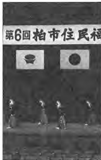
アトラクションも交え柏の福祉を考える=昨年度の同大会

みんなが幸せを感じる温かい地域社会づくりをテーマに「第七回住民福祉大会」が開かれます。柏の福祉の現状を理解していただくための事例発表や表彰、アトラクションが予定されています。お気軽においで下さい。 〇とき 十月二十八日(火)の午後一時半から 〇ところ 柏市民文化会館大ホール 〇問い合わせ 柏市社会福祉協議会(電話63-9001)へ。