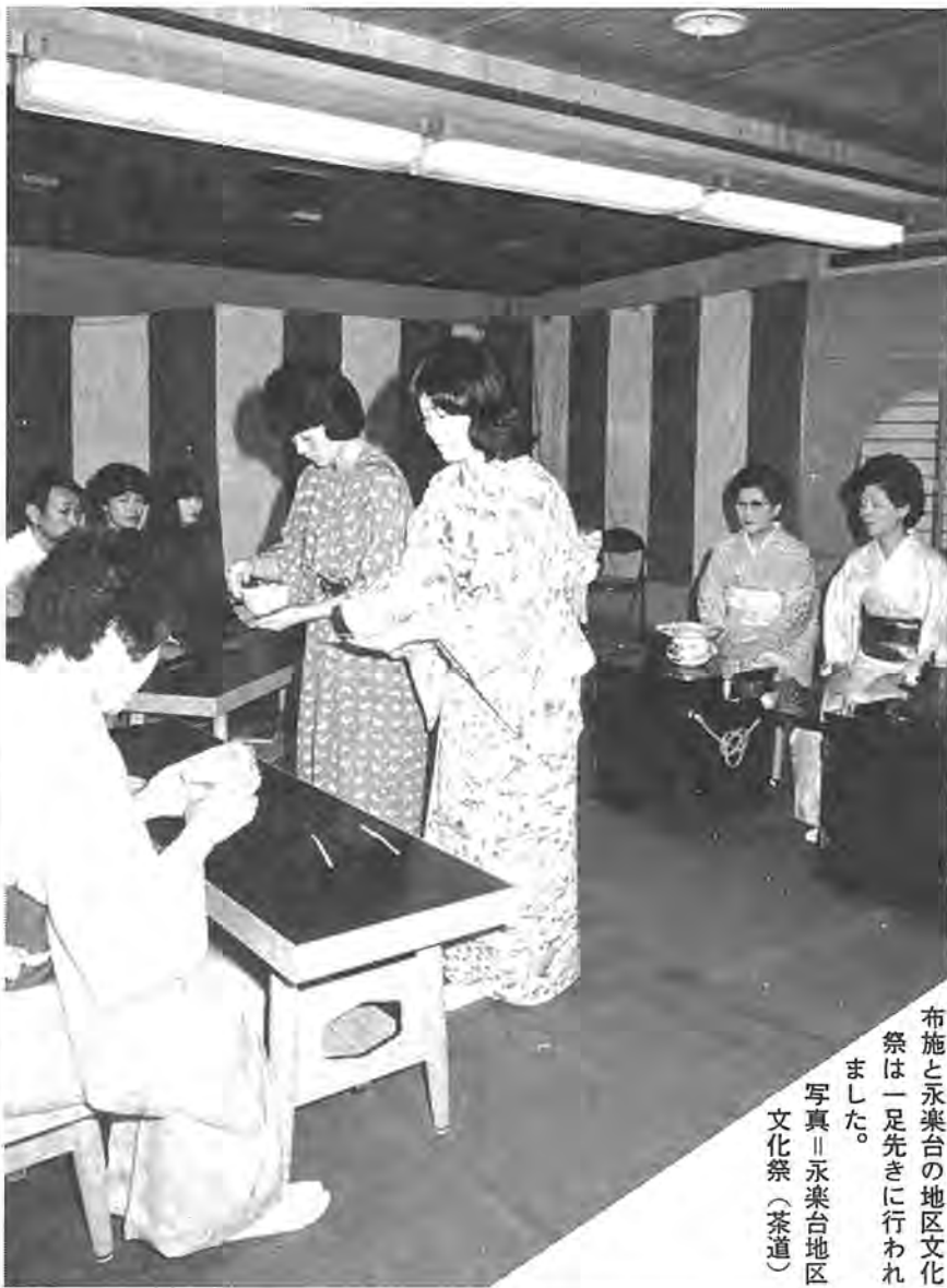
布施と永楽台の地区文化祭は一足先きに行われ、写真「永楽台地区文化祭(茶道)」