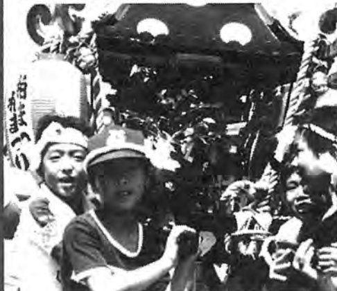
▲ 富勢地区大会 (7月20日)