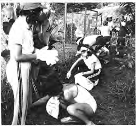
フェンスのそばの草も感謝の気持ちで、手で一本ずついねいに

同団地自治会では、この交流をさらに深めるために、同村の特産物の直売など経済的な交流にまで高めたいとしています。また里見村と同団地との交流の輪をさらに全市的に広げるため、鈴木市長もこのサマーキャンプに同行、フットボールの始球式やキャンプファイヤーに参加するなど積極的に同村との交流を深めました。