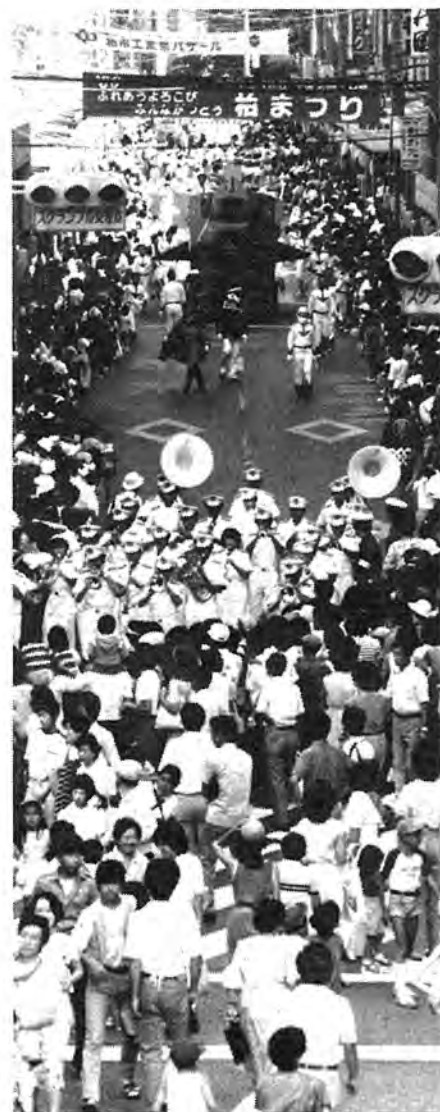
▲ 「ミュージックパレード」 祭りの花ともいえるパレードで、人気パツグンの宇宙戦艦ヤマトや白雪姫、ミュージックカーなども登場。大人も子供もお喜び

八月九日、十日の二日間にわたって「柏まつり」が、柏駅周辺を中心に盛大に繰り広げられました。三回目を迎えた今年も西原、田中、富勢、南部の各地区で行われた柏まつり地区大会の代表者もここに参加するなど、市民総ぐるみの夏の祭典となりました。「ふれあうよろこび みんながつどろ」をメインテーマとして、ミュージックパレード、みこし、歌うミス柏コンテスト、「柏おどり」や「ふるさと音頭」のパレード、工業展など催しも盛りだくさん。二日間の祭典もあっといふ間に過ぎさつたようです。今号では「柏まつり」の様子を写真で紹介してみました。