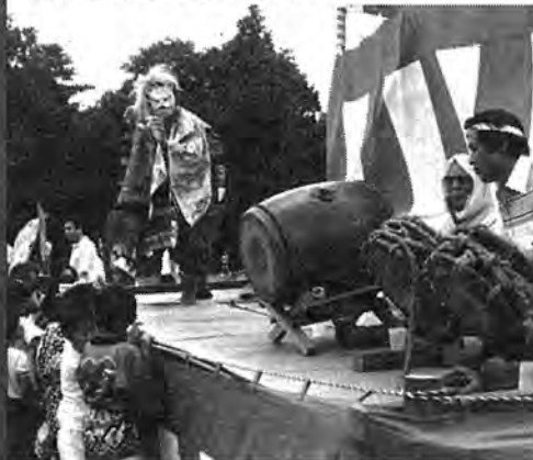
▲ 南部地区大会 (7月27日)