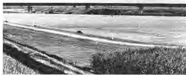
利根の広大な河川敷に整備された八面の野球場。一後方の橋は大利根橋有料道路

「人間性豊かな生活文化都市」を将来像に――柏市はこのほど、昭和六十五年の都市形成を目標に、「ふるさと柏の創造」を副題とする柏市基本構想をとりまとめ、八月八日、市役所で開かれた第五回総合計画審議会(鈴木三郎会長)に諮問しました。これは、これまで同審議会でも審議されてきた基本構想の視点や骨子をもとに作成したもので、「基本構想の策定に当たって」「柏市の将来像」「施策の大綱」「基本構想実現の方策」の四章からなるもの。今後は、その理念と施策の大綱をもとに引き続き「基本計画」の策定に取り組むことになりました。