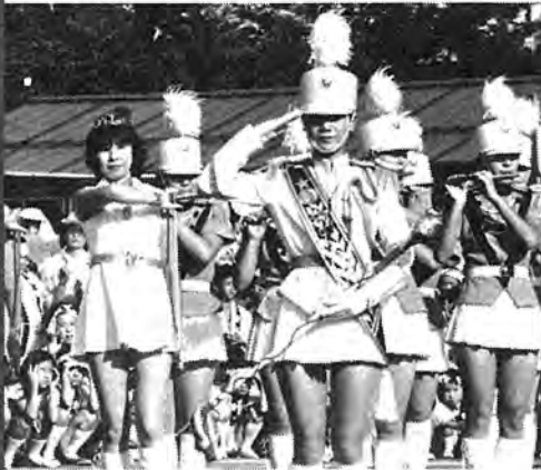
▲ 西原地区大会 (7月27日)