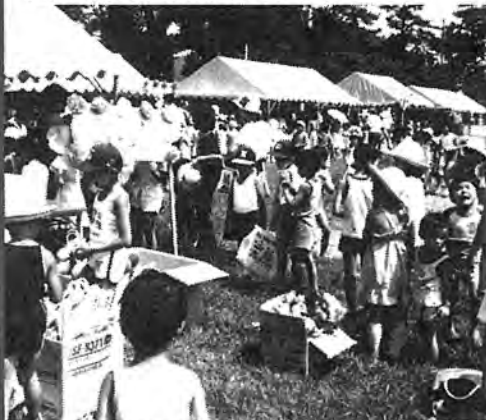
▲ 田中地区大会 (7月26・27日)