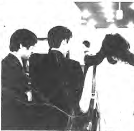
春は非行の増える季節。市の補導員も積極的に「愛のひと声運動」を展開中

春先は、青少年にとって入学、卒業、就職など生活環境が大きく変化し、精神的にも不安定になりがちで、非行が目だつて増える時期です。特に受験を終えた生徒は、進路が決定した解放感も手伝