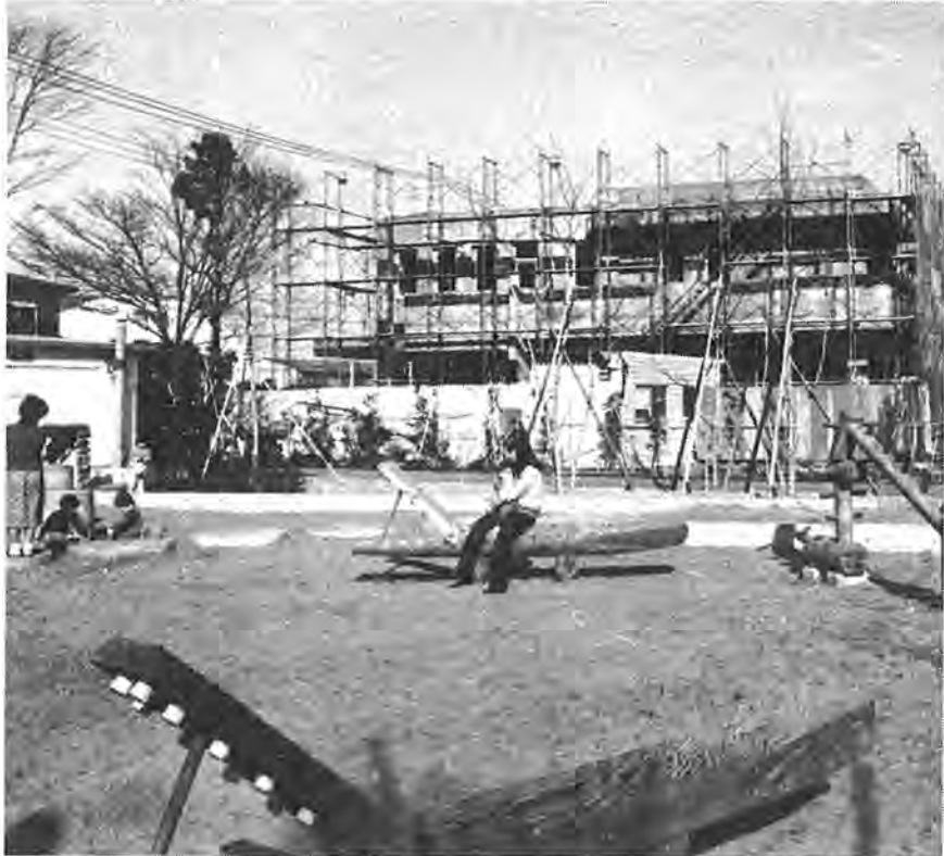
市民のいこいの場近隣公園に接して急ピッチに建設の進む永楽台近隣センター。55年度にはさらに地域住民のふれあいの場としての近隣センター2館ができる予定

昭和五十五年第一回定例市議会が三月七日から同二十五日まで十九日間の会期で開かれてい ます。この議会では、水道料金の改定や柏市職員定数条例の改正、敬老祝金や遺児手当の増 額、コミュニティ活動を積極的に推進するための事業費補助および国民健康保険であんまや指 圧などの施設を受けた場合にも給付金五百円を支給するための条例の改正など三十六議案が審 議されています。また、「ふるさと運動の推進」「周辺整備事業」に重点をおいた昭和五十五 年度の予算案(一般会計三百四十三億五千五百万円、特別会計百八億九千八百八十九万円)も審議さ れています。今号では、この三月議会に提出された議案のうち主なものを紹介することにしま した。また、新年度予算の詳しい内容については次号で特集する予定です。