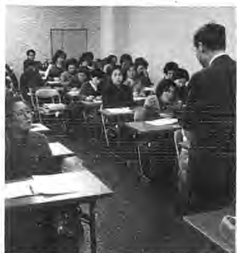
生活に直接影響する問題だけに受講者の表情も真剣

全国各地で合成洗剤の使用が話題になっているだけに、センターに駆けつけた主婦たちは五十人を越し、会場はいっぱい。講師に招かれた東京医科歯科大 柳澤文