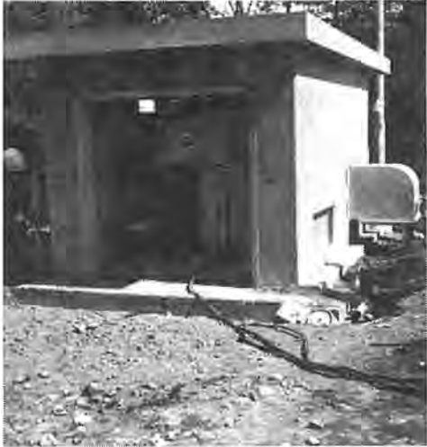
災害など多目的な利用が可能な水供給装置

地震など災害時に、もし飲料水不安を解消するため光ケ丘中の校舎に設置された。市ではこの一帯に約千八百万円をかけて耐震性が途絶えたら――。市ではこの一帯に約千八百万円をかけて耐震性が途絶えたら――。市ではこの一帯に約千八百万円をかけて耐震性が途絶えたら――。