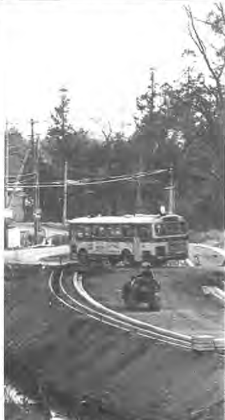
船戸の「魔のカーブ」も広くゆったりとした道路に

く曲るカーブがあつて車両交通の「ガン」となっていました。工事では、このカーブを避け、新たに道路線が敷かれ、その曲がりの半径も二百才へと、ゆったりとしたカーブに変えられました。