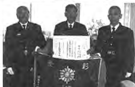
消防庁長官から贈られた表彰旗

報告に市役所を訪れた関係者は「団員、職員などが一丸となって消防力を向上させてきたことが認められうれしい。この表彰を機にさらに市民の財産・生命を守る消防機能を充実させたい」と語りました。