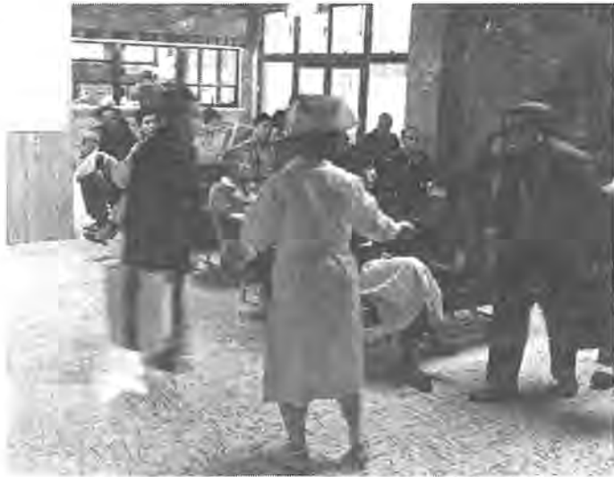
外来診療1日300人まで可能な国立柏病院。駆けつけた患者が待つ受付周辺にもあわただしさが

県北の医療機関の中核を担うとして、昭和五十三年四月、国立療養所柏病院から生まれ変わった国立柏病院はスタートして三年目を迎えようとしています。昨年十二月まで同病院を訪れた外来患者は延べにして約八万六千人。救急医療をはじめ地元医療機関からの紹介など地域医療の核的体制への足がかりの時期を終え、今後は、より高次の医療機能を果たす病院を目指しています。昨年、市が実施した市民意識調査でも医療施設への期待度は相変わらずトップ。そうした意味では、同病院の整備充実に向けて市民の期待は大きいようです。