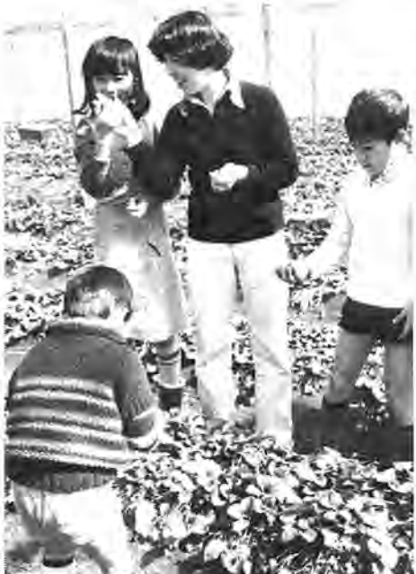
もつすべたべーん

さて、国民年金の老齢年金を受給するには、生年月日によって、六十歳までにそれぞれ納めなければならぬ、最低必要な期間(受給資格期間)が別表①のとおり決められています。 例えば、大正八年四月五日生まれの方は十四年間以上必要です。昭和五十三年四月五日生まれの方は、二十五年間以上必要です。あなたの生年月日にあてはめて、必要な期間を調べて下さい。その結果、あなたがこれより六十歳までに納めて別表①の最低必要な期間に足りなかった場合は、受給資格に必要期間分の保険料を納めて下さい。