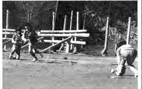
相手チームの出現を待ちながら練習に熱が入るプリティーズ

「イクワヨー」「オー」と、大きな掛け声が土南部小の校庭から聞こえてくる。赤いユニフォームに身を包んだ女の子たちが北風の吹く中、元気に白球を追いかけている。とても、女子ソフトボールチームとは思えない迫力。 このチームの名は「プリティーズ」(崎野監督)。結成は昨年九月で、男子の野球やサッカーの練習を見たり、応援しているうちに「私たちがみんなやれるソフトボールをしよう」と、話し合ったのがキッカ。 メンバーは、小新山町会に住む小学四年生から六年生までの女子児童十五人からなる。なにせ女子だけのチーム。ルールはもちろん、グローブの持ち方、バットの握り方も知らないとい