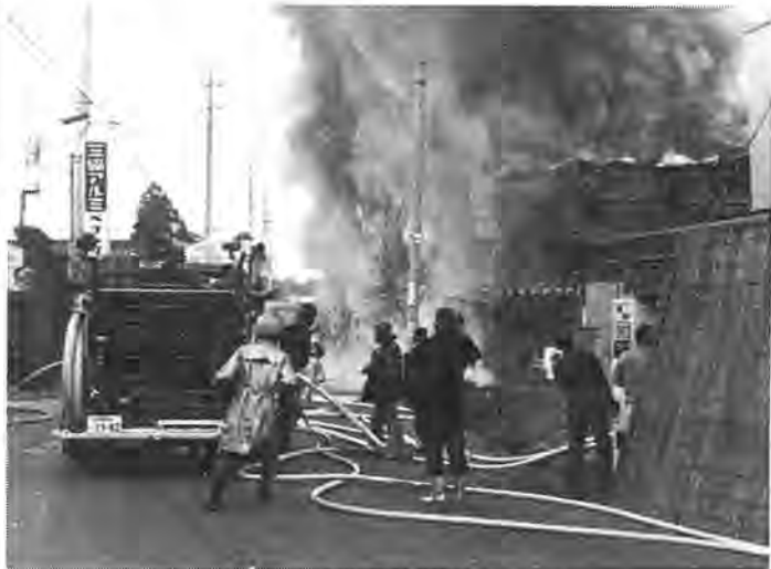
ちょっとした不注意が恐ろしい火災につながります

火災は、昼夜を問わずいつ発生するかわからないもの。もし、火災が発生すれば貴重な財産をはじめ、尊い人命までも失われることがあります。これからの季節は空気が異常に乾燥し、強い風が吹いたりして火災が発生しやすくなります。火災の発生件数も一年間の三分の三が一月から三月までの時期に集中しています。このため、二月二十九日から三月十三日まで「これくらい」という油断を火が狙う」を統一スローガンに、全国いっせいに春の火災予防運動が展開されます。市民の皆さん、この火災予防運動を機会に家族ぐるみで、火災予防に対する認識を新たにしましょう。