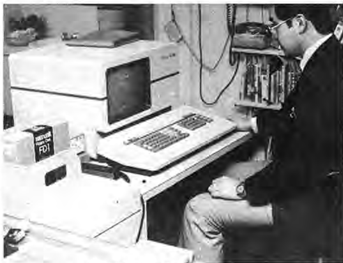
作業を待つばかりのコンピューター ＝市立図書館本館で

返却の方法は、読み終わった本をカウンターに置いておくだけでよく、都合の悪い場合には本人でなくても返却できます。もちろん今年完成する布施、永楽台、増尾