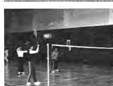
「それっわよ！」と、まずは基本練習

「バドミントンって美容にもいいものなのね。準備体操、ラッパ、基本練習、これだけでもかなりの運動量になります」