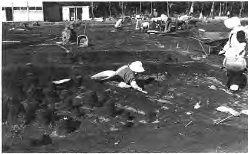
遺跡内で掘り出された住居跡からは 弥生、古墳期の息づかいが...