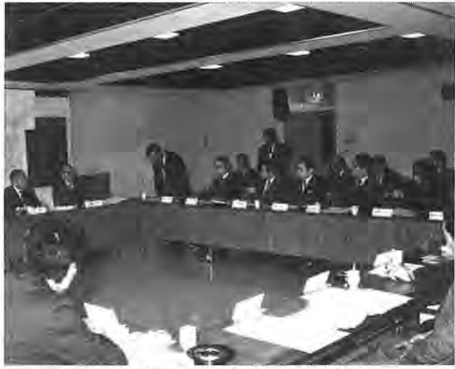
今後の柏市の指針を話し合う「総合計画審議会」の委員さんたち