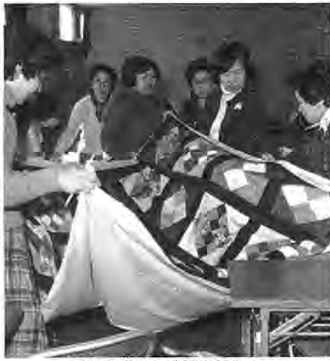
出精に準備した消費生活展の柏市生活クラブのみ

「見直そうわがふるさと、考えようわが暮らし」をテーマにした「消費生活展」が柏市消費生活展実行委員会の主催で開催されます。期間は二月一日(同六日の午前十時から午後六時(六日は午後五時))までで、場所は柏市消費生活センターです。