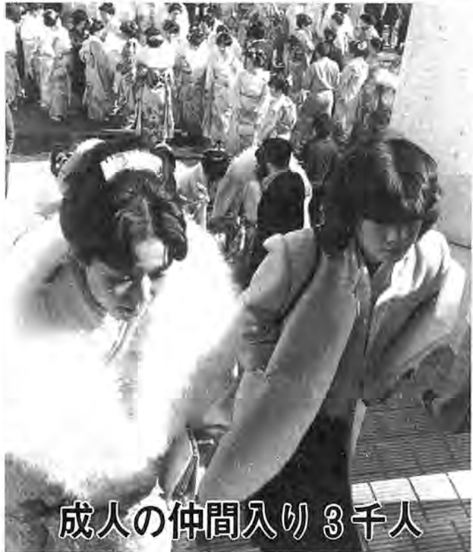
成人の仲間入り 3千人 祝典 手づくりで盛り上げ