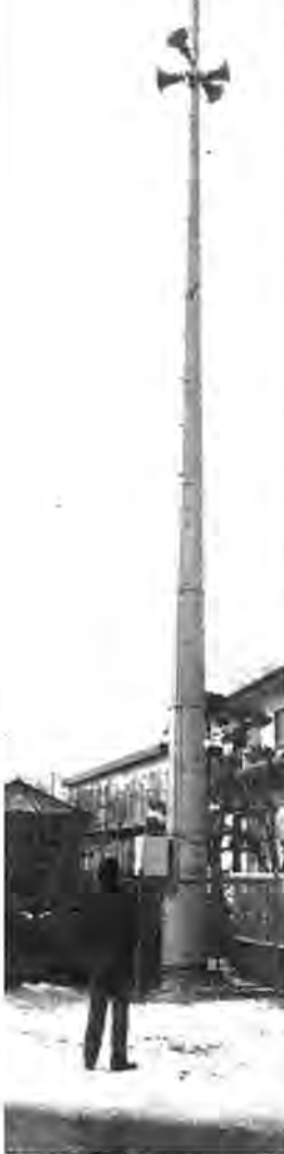
富士見保育園の中に建つ屋外受信局

メートルの風にも、地震にも十分耐えられる構造で、災害時などの情報伝達に大きな効果が発揮できるものと期待されています。 22日から試験放送 音声テストにご協力を 広報無線用の屋外受信局の試験放送を、一月二十二日から二十八日にかけて行います。これは、スピーカーの音の指向性などを確かめるもので、瞬間的にテストの音が発せられます。