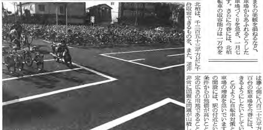
南柏西口に新設された自転車駐車場。市内最大の収容力を誇り、まだまだ余裕が

市内の各駅付近に放置される自転車の群れ。歩行者の安全やまわりの美観を損ねるなど、近年、都市の悩みの一つになっていっています。市が設けた自転車駐車場からあふれるこうした二輪車は、昨年九月の調べで約八千五百台。この解決策に、駐車場づくりを急ぎ、一月七日南柏駅西口に新設したものを始め、現在十三万平方メートルに設置されています。さらに今春には、北柏に千台の、また、逆井に七百台の自転車駐車場を計画しています。これで、自転車の収容能力は一万台を超える見込みです。各駅付近での放置状態をみてみました。 冬の朝、白い息を吐きながら、市内各駅付近で、市内全体で八千四百台、五年前より二・四倍と増えています。国・私鉄各駅周辺の自転車の放置状況は、北柏で五千三百台、南柏千三百台、北柏二百七十台、豊四季、増尾それぞれ約六百台、逆井三百五十台という分布。こうした野放図に置かれる自転車による交通障害などの解消に、市では、駅付近に自転車駐車場づくりを進めています。現在、これら自転車駐車場は十三万平方メートルに九千九百五十台に達しています。ここに入る可能台数は、約八千五百台に達しています。したがって、駅付近に集まる自転車総数のうち、放置自転車の率は、昭和四十九年七〇%を占めていたものが、昨年九月には四九%にまで落ちてきています。 昭和五十四年度には、南柏に引き続き、北柏と逆井の両駅近くに新たな自転車駐車場を設ける計画です。