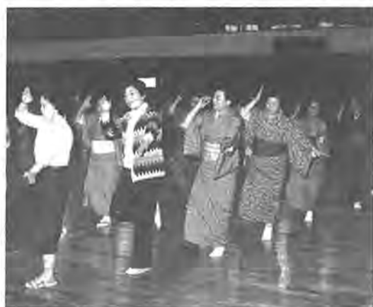
『かしわふるさと音頭』 踊りの振り付け決まる

一方、歯科相談には、三千二百一人が受診し、その結果、虫歯などの疑いのある幼児は二百八十二人(り患者率八・八%)いました。