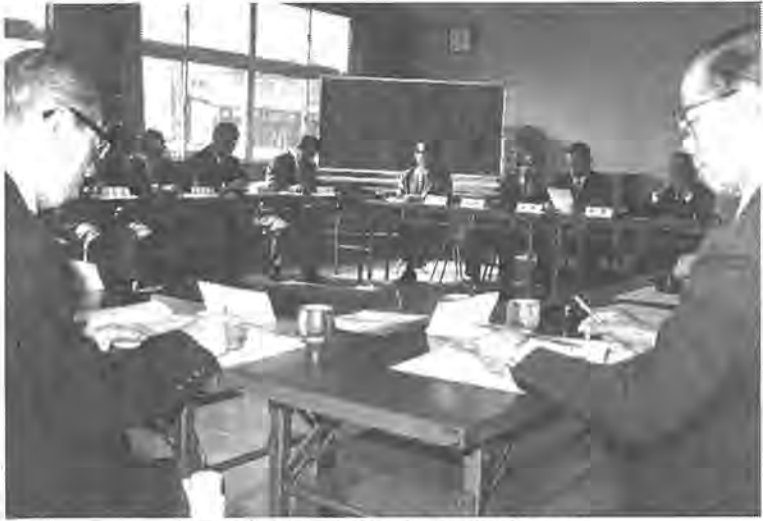
会長も決まり、今後の活動が期待される「ふるさと運動推進協議会」の初代会合風景

市制二十五周年記念式典」が行われる十一月二十八日以降、各地区の行政連絡員を通じて、全世帯に無料でお届けすることになります。来月初旬までにはお手元に届くと思われませんが、万一それまでに届かない場合は企画調整部広報課(内線二三三)までお問い合わせ下さい。