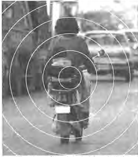
手軽に乗れる軽バイク、でも二人乗りなどの危ない乗り方はやめてほしいもの

だれでも気軽に乗れる軽バイクが、最近自乗車に変わって普及してきています。五十CC以下のエンジンを備え、時速三十キロ以下で走るこの種のバイク、特に主婦層に大もてのようです。こうした人気の裏で、この原動機付き第一種のバイク事故が増加しているのは確かです。便利さとかっこ良さに目が奪われ、うっかりルールをはずれると、思わぬ事故につながることも。ルールを守り、慎重な気持ちでハンドルを握る心がけだけは忘れないように。