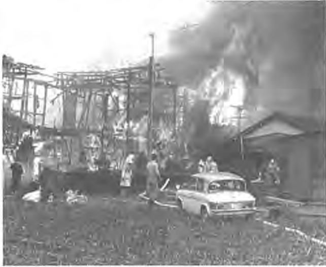
大切な財産を灰にしないためにも油断は禁物です

「これくらいと思う油断を火が狙う」——秋の全国火災予防運動が十二月二十六日から十二月二日まで繰り広げられます。重点目標は、「幼児、老人、身体不自由者等の焼死防止対策の徹底」「防火管理体制の確立」「地域ぐるみの自主防火防災体制づくりの推進」の三つ。昭和五十四年上半期の火災概要をみると、出火件数、焼損棟数、死者数ともに、前年同期よりも減っており、これは非常に喜ばしい傾向といえます。が、これから火災シーズン。減少傾向を維持していくためには、市民一人ひとりが、今後も火の元に気を配ることが大切です。ちょっとした油断があなたの大切な財産を灰にしてしまうのです。寒さの訪れを前に、暖房器具を使う機会が多くなるこの時期、あなたの心に油断という悪魔はひそんでいませんか。