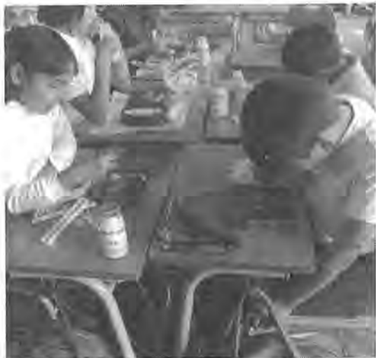
今日のおかずはなにか、弁当箱で配られる副食給食に舌鼓