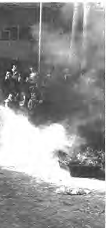
燃え上がる炎。「落ちついて、まず火元から消すことです」とのアドバイスのもと実地の消火訓練。柏グリーンハイツにて昨年11月撮影

このような事態において、被害の防止または軽減を図るためには、住民自ら出火防止、初期消火、被災者の救出救護、避難などを行うことが最も重要になります。