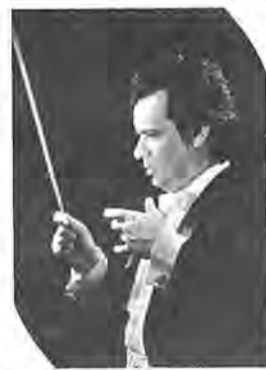
首席指揮者 ユーリー・シモノフ

柏市民文化会館が開館して七周年。これを記念して同館では、「二葉団」を招き、九月二十九日演奏会を開きます。