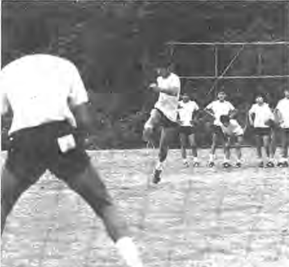
部活動で夏の間を規律あるものにするのも二学期でくじけない一つの方法—酒井根中

柏市少年補導センターは柏警察署、市内での少年たちの非行化防止を図るため、街頭補導を行い、