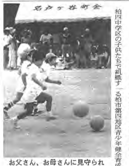
お父さん、お母さんに見守られ奮戦するよい子たち

柏四中学区の子供たちで組織する柏市第四地区青少年健全育成協会の運動会が、八月二十四日名戸ヶ谷小で「夏期スポーツ大会」を開きました。