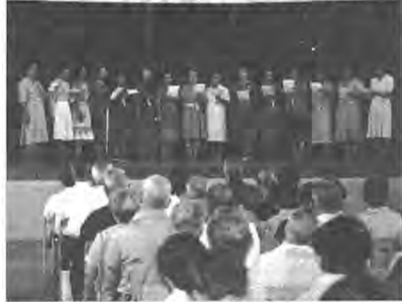
地域の人々がお年寄りを祝福するのが敬老会。地元のママさんも美声をひろう。—昨年柏中—