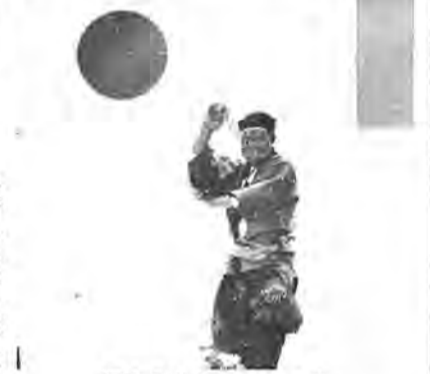
郷土の芸能にも大きな拍手が送られました

り広げられました。盆栽、書道、絵画、手芸などの展示、柏市消防音楽隊の演奏、おびしや踊り、地元住民の演奏などの芸能に飛脚製作所の吹奏楽団、アマチュアオーケストラ・柏交響楽団も駆けつけ、行事に華をそえました。一方、同体育館と田中の校庭などを使ってスポーツ大会も行われました。コミュニティの場としての近隣センター。まさに、文化・スポーツの殿堂と言えそうです。