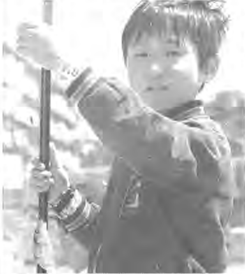
つれた、つれた!! =東口市民プールで

東口の市民プールで、放流された五千匹のしぎごいの稚魚をつつてもらおうと子供つり会が開かれました。五月三日、五日に集まった「豆太公望」は五百人。つりは、小学生の間でも静かなアムとか。近ごろはりール付きのさおを持つなど本格的で、思い思いのかつこうで