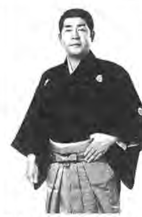
青空ヒッチハイクほか ○前売所 柏そごう友の会(本館六階)、柏タカシマヤ友の会(中二階)、浅野書店(スカイプラザ柏三階)

柏市民文化会館の主催で『ふるさとの歌・民謡 三橋美智也 ショー』が開かれます。入場前売券は各前売所で五月十一日から発売。