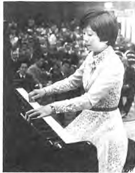
ピアノの演奏にもしばしうっとり