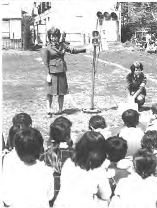
信号は青でも左右の安全を確かめてから渡ってね! =交通教室・富士見町町会