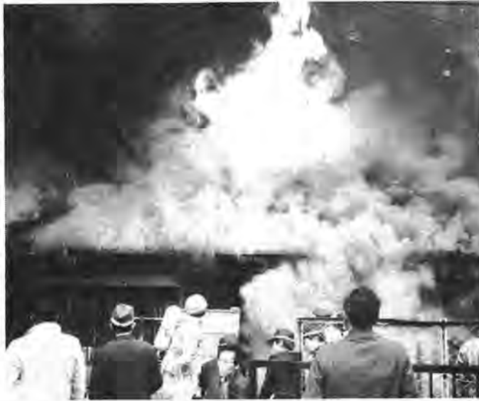
火災は大切な財産を瞬間のうちに灰に (昭和53年12月15日撮影)

空気が乾燥し、風の強い日が多い二月、三月は火災の発生が最も多いシーズンでもあります。そこで、二月二十八日から三月十三日まで火災に対する心構えを新たにしておこうと「春の全国火災予防運動」が繰り広げられます。重点目標は「幼児、老人、身体不自由者を中心とした焼死防止対策の徹底」「デパート、ホテル、雑居ビル等の自主防火管理体制の確立」などです。「それぞれの持場で生かせ火の用心」。この今年のスローガンはあなたの心にどのような火災への警鐘を鳴らしてくれるでしょうか。