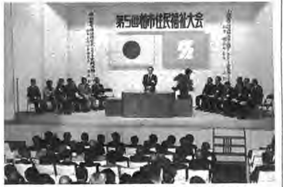
心の福祉を目指そうとする意気込み が感じられた住民福祉大会

一月三十日、柏市民文化会館小ホールで柏市社会福祉協議会の主催による「第五回柏市住民福祉大会」が開かれました。 この大会は、地域に密着した福祉活動のあり方について話し合い、地域相互に共通の理解を深め、福祉をより充実させようという趣旨で行われたものです。