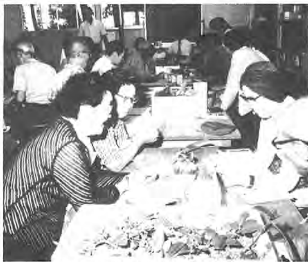
働くうえでの特技がこうした機会を通じて養成されていくことも = 柏寿荘の園芸教室

一方、昨年四月から十二月までの求人数は、百八十三人。職種を見ると製造業の軽作業やビル管理の清掃業務、監視、ガードマンなどの労働が約七〇%。次いで経理や営業の事務職、ポイラー操作など資格、免許を必要とする特殊技術職の順となっています。 給与面では、男性が八万円から十五万円、女性は六万円から八万円が相場。求人側の希望する年齢は、六十五歳までがほとんどを占め、六十五歳までがほとんどを占め、それを越えるとは急減しています。 そこで、求人数と新規求職者の割合、すなわち求人倍率をみると、四月から十二月の平均は〇・三九。不況の影響からか昭和五十年の〇・六〇から低下してきている傾向にあります。ちなみに、昨年九月の県内での一般の有効求人倍率は〇・七八。高齢者の就職状況は、一般より厳しい一面をのぞかせています。 しかし、就職した人と新規求職者数との割合は、五十一年度が一・八・三、五十二年度二・二、昨年四月から十二月までが二・六・二と求人倍率が低下している中で、就職する人の率は増えています。これは、高齢者の本心に働きたいという意欲が高まってきているのと、企業側にも高齢労働力を生かそうということのあらわれとして見えます。