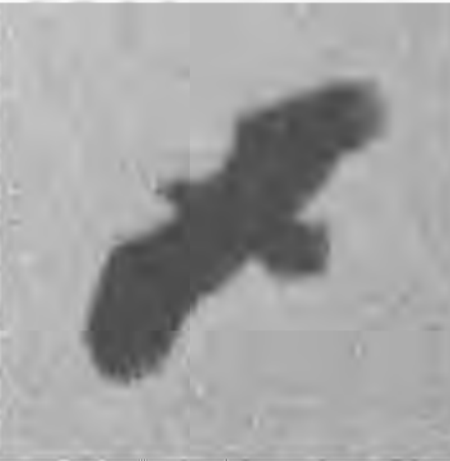
北海道ではよく見られるが、内地では少ない鳥である。冬の手賀沼上空に現れることがあり、トビよりひとまわり大きく雄大である。(写真と文・千葉県生物学会委員 斎藤吉永氏)