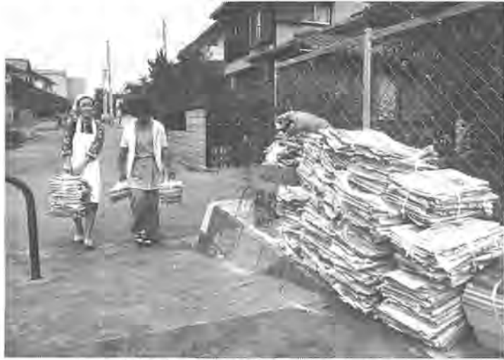
朝9時前、続々各家庭から資源ゴミが集積所に（酒井根東で）

石油ショック以後、省資源の気運が高まる中で、ゴミの再利用とゴミ減量を目的としたリサイクル（資源回収）が見直されています。市でも、ゴミの資源化と減量が図れる一石二鳥のリサイクル運動を展開し、現在21の町会が実施しています。今年四月から八月までに回収された資源ゴミは、これら町会で約百トン。ゴミ問題が、市民に理解されるにつれ、この運動は、今後ますます広がります。