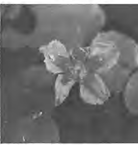
《アサザ》 手賀沼の水草には、美しい花の咲くものが多かったが、それらの中でいち早く消えたものが、この黄金色の花の咲くアサザであった。(写真と文・千葉県生物学会委員 斎藤吉永氏)