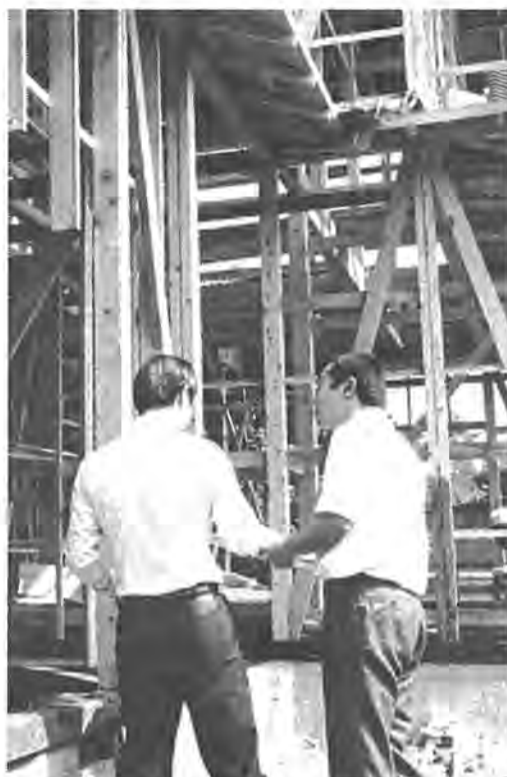
違反がないか入念な調査を行う市職員

十一月十二日の任期満了に伴う市長選挙と欠員の生じた市議会議員補欠選挙(定数一人)は、十月十二日(木)に告示、十月二十一日(日)投票日と決まりました。 この選挙は、発展を続ける二十三万柏市を担う市政の執行にあたる市長と議会を通じて市政に反映させる市議会議員を選ぶものです。