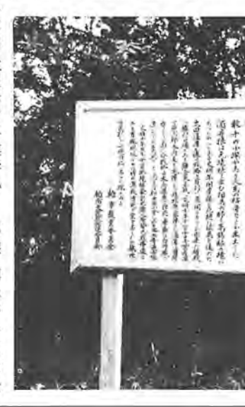
酒井根合戦場(合戦場)の石碑

○とき 十月二十二日(日)午前九時開会 ○ところ 柏市市民体育館(参加チームが多い場合は会場を分散) ○資格 一町会男女一チームずつ。柏市ママさんバレーボール協会、柏市および千葉県のパレーボール協会登録者は一チーム二人までとします。○参加費 一チーム二千円 ○申し込み 官製ハガキに①町会名(チーム名)②代表者名と連絡先 ③参加選手名を明記して、十月十日(当日消印有効)までに次のところへ。 〒二七七 柏市旭町五十一一八、アサヒスポーツパレス内、柏市バレーボール協会事務局あて。 ○問い合わせ 同事務局(43-二〇三九)へ。