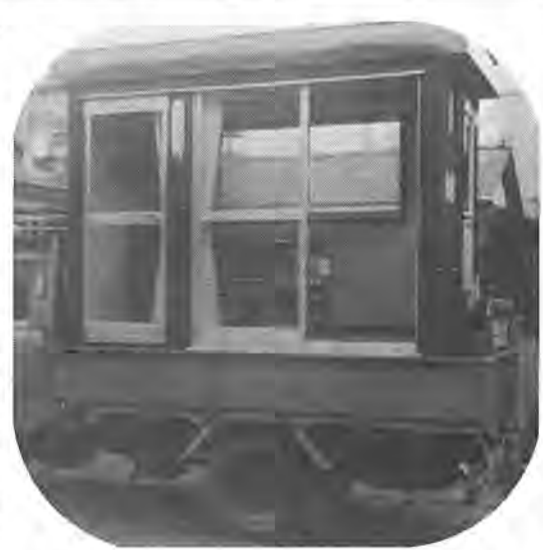
震度7までの地震を体験できる「起震車」

また、十二月議会では、六億一千七百万円の補正も行われ、今年度の一般会計予算の総額は、二百三十五億六千三百万円になります。