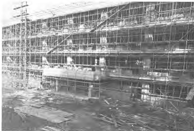
4月の開校めざして、モダンな校舎づくりが進む増尾西小学校

昭和五十二年十二月の定例市議会は、十二月九日から二十一日までの十三日間におわって開かれました。この議会では、土小分離校、土南部小分離校、光ヶ丘中分離校の開校に伴う条例の一部改正や職員定数条例の改正、公害防止条例の一部改正など十六議案が提出され、原案どおり可決されました。また同時に、昭和五十一年度の決算も認定されました。議案の主なものは、次のとおりです。