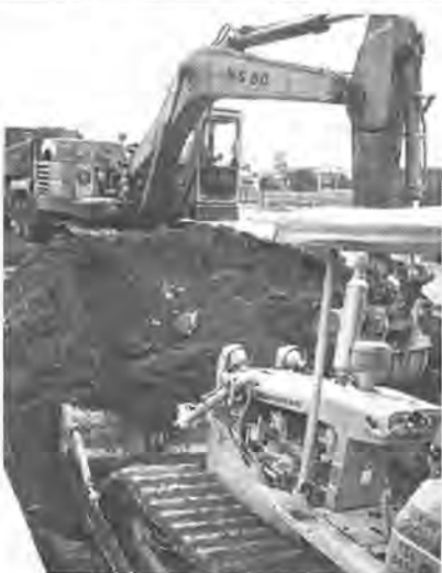
工事現場での「振動」も規制の対象になります

規制の対象となるのは、くい打機、くい抜機、鋼球を使用する工作物の破壊、舗装版破砕機などにより発生する振動です。また対象地域は、住居地域はもとより、商業地域、工業地域、さらに市街地調整区域の一部まで含む広範囲に適用されます。これにより事業主および管理者は必要な防振施設(設置など)により、規制基準(屋敷・地域により異なる)を遵守しなければなりません。