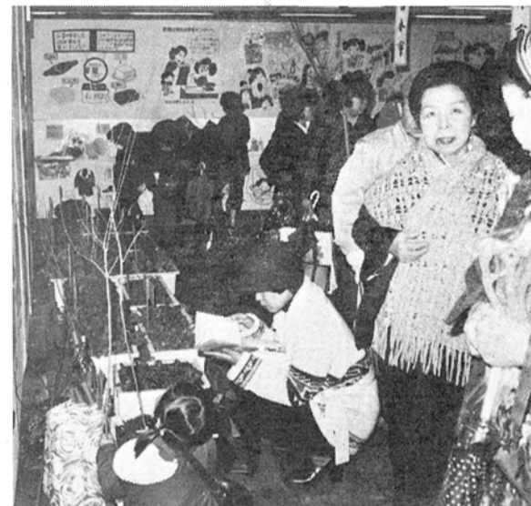
昨年の消費生活展から

柏市消費生活センターは、昨年全世帯に急速に広まった「二百カイル」を中心にみんなで考えようとしています。ここでは、二百カイルの影響が食生活をどのように変えたかを市内三百世帯を対象に行ったアンケートでその動向をみようとしています。この他、二