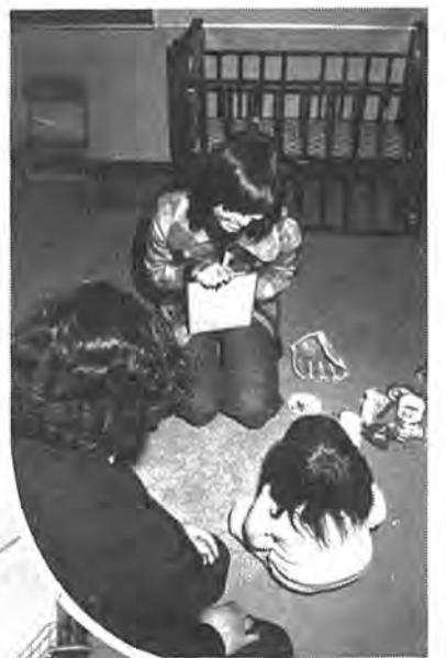
▶5月、十余二学区内に言語指導室が開設されました。これは、言葉の発育に問題がある就学前の幼児を持つているお父さん、お母さんの相談に応じるもので、これまで六十九人が利用しています。