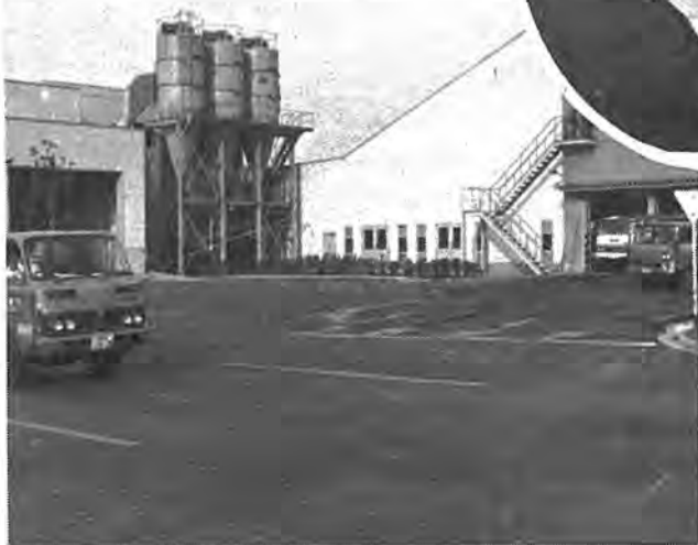
▲三億二千八百万円の巨費を投じて導入された破砕施設。燃えないゴミを細かく破砕し、鉄分などは集めて再利用。埋め立て地へ捨てるゴミの量は五分の一に減りました。都市の大きな悩みであるゴミ問題もその解消に再び大きく前進しました。