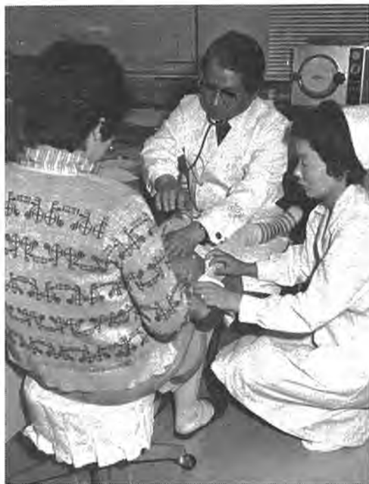
▲保健衛生の中核となる「柏市保健センター」が完成。4月から内科・小児科(急病センター)・歯科(休日歯科診療所)が診療を始めました。11月までに利用した人は急病センターが779人(一日平均19人)、歯科診療所が469人(一日平均11人)と需要の高さがうかがわれます。