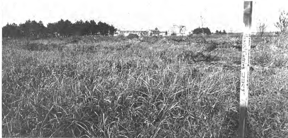
▲9月、米軍柏通信所の総面積183万m 2 のうち、半分以上に当たる95万m 2 が返還されました。一方残りの未返還部分には新たに海空の航行安全を図るロランC局が。こうした新たな局面を迎え、国の三分割有償方式という厚い壁が見られますが、返還地、緩衝地の利用計画など今後の成り行きが注目されます。

今年も残すはあとわずか。この一年をふりかえてみると、低迷し続ける国の経済の影響を受け、市の行財政は、依然厳しい状況でした。こうした中で、市民の福祉向上を進める上では意義深い年であったように思います。この九月、約半分の九十五万平方メートルが正式に国に返還されることになった米軍柏通信所は、今後の跡地利用問題などを含め、本年最大の市政の焦点ともなりました。また今年、地方自治が生まれて三十年。この記念すべき年に、本市の行財政運営が健全に行われてきたことに対し、国から表彰を受けました。これは、市民の積極的な街づくりにへの協力が評価されたものと考えられます。本年の主な施策を見ると、市民生活と健康増進を確保するための保健センター、市民体育館が今春相次いでオープン。教育施設では、小、中三校の開校に続いて、初の市立高校、幼稚園の建設が着手され、一段と教育面での充実が図られました。一方、増加の一途をたどるゴミ問題においては、その減量と再利用の解決策として粗大ゴミ処理施設を完成。また福祉では、言語指導室の開設など、幼児からお年寄りまでより厚い施策が加えられました。今号では、この一年の主な動きを写真で追ってみました。