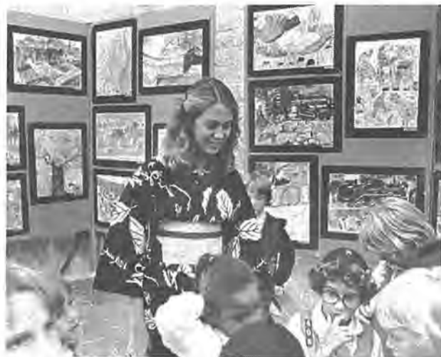
柏市と日本の文化を紹介しようと、毎年ト市で開催されている「文化祭」。今年は柏の小学生から送られた絵がたくさん展示されました

柏市と米國・トランス市(カ)リフォルニア州)は、姉妹都市の関係を結んでから、来年二月で五周年を迎えます。そこで、柏市・トランス市姉妹都市委員会では、五周年を記念して、茶道、生け花、書道など、胸に自信のあるリフォルニア州)は、姉妹都市の関係を結んでから、来年二月で五周年を迎えます。そこで、柏市・トランス市姉妹都市委員会では、五周年を記念して、茶道、生