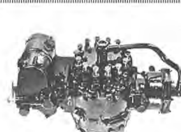
生産された噴射ポンプ

ろいろな事件の解決に貢献してきた。いつの世でも怪奇な事件がある。数え切れないほど経験した一つ一つの外見所見を克明にノートに記録してある「これは一語にスライドにとつてある写真と共に、他のどんな法医学書にも負けぬ文献だ」と胸を張る