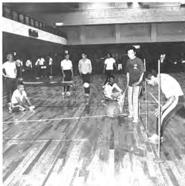
▲5月1日、待望の「市民体育館」が保健センターに隣接してオープン。1,100人収容の観覧席のある主体育室や柔道場、剣道場、トレーニング室などを備えた本格的なもの。11月までに延べ48,000人余りの市民が利用し、健康増進に一役買っています。