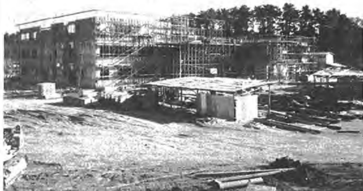
▲市立柏高校(船戸山高野)の建設工事が来春四月の開校をめざして急ピッチで進められています。初年度は、八クラス三百六十人が入学。逆井に同時に開校する県立柏陵高校を合わせると市内の公立高校はこれで五校。市内中学生の進学問題も緩和の方向へ。