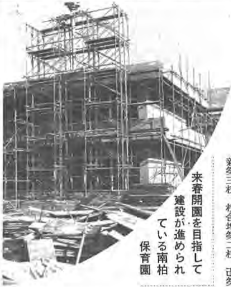
来春開園を目指して建設が進められている南柏保育園