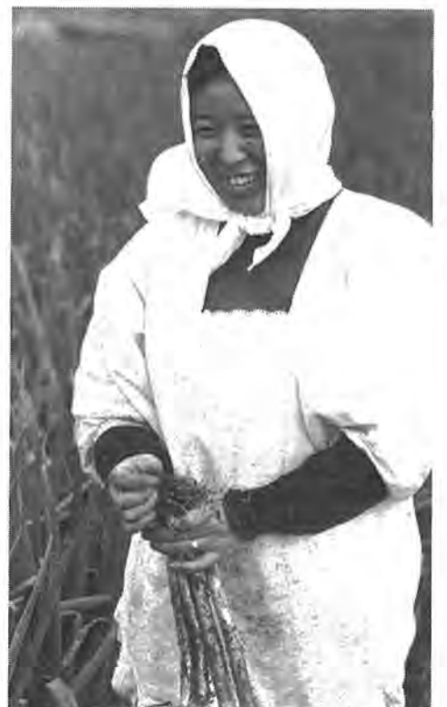
▷喜び◁ 女性の労働力はまだまだ主力。だが、土に生きる喜びが... 富勢で