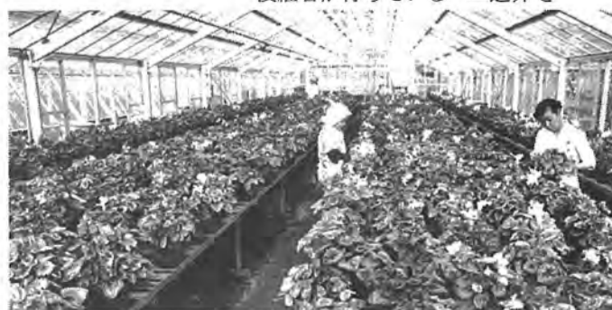
▷花き◁ 野菜中心の柏の農業でも少数派だが、定着してきた。12月の出荷を前にシクラメンの花がチラホラ 大青田で

秋の異常高温。野菜の安値が続いている。ホウレン草は市場で十円以下とか。その店頭では... 逆井で