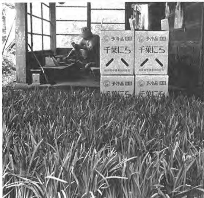
▷千葉ニラ◁ 田中地区はニラの名産地。手間が省けると市場価格が安定しているのが魅力 大室で