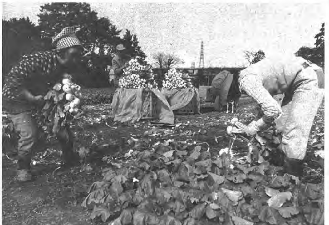
▷全国一◁ 味と形、生産量とも全国一の柏の小カブ。豊四季地区が中心産地だったが、市内全域に広がりつつある。今が最盛期で各農家は出荷でいそがしい 豊四季で

都市近郊型の典型といわれる柏の農業。市街化が進む中で農業環境の悪化、営農意欲の喪失などで農業人口、耕作地は急速に減少しました。市農政課資料によると昭和四十六年を百とすると昨年の農業人口は八十の指数、経営耕地面積では七十一に低下し、「離農」の現象はぬぐい切れません。 しかし、五十年を境に農業の構造的な部分に変化がでているのが注目されます。一時、専業農家は、全農家の十五%に落ちましたが、五十年から増加し昨年は二十一%に回復。さらに、生産年齢である十六歳から五十九歳の従事者中、男は三十七%と低く、まさに農業は女性に支えられている感がありました。昨年は四十六%にも戻し、農業に新たな動きが見られます。これは、石油ショック以後の景気低迷による雇用事情の変化と長期的な食糧危機感などから農業の見直しが進んだ事などが一因ともいわれます。が、とりもなおさず農業者の小教精鋭化が進んでいる事は確かです。 市内農業粗生産額の中で、八十%を上回る近郊園芸中心の柏の農業は、生産効率が高く、換金性が早い野菜、花きを抜きにして語れません。巻き返しを図る農業の実態を柏の特産カブ、ニラを中心にその産地を歩いてみました。