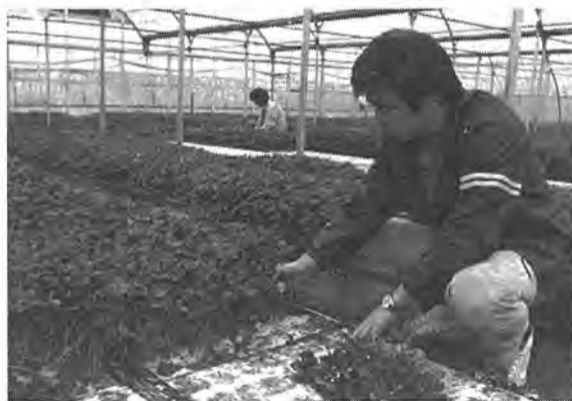
▷技術革新◁ 柏で初めて導入された「水耕栽培」。新しい農法に取り組む若い後継者が育っている 逆井で