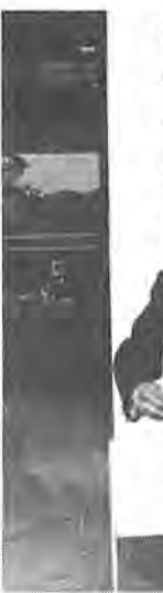
表彰状を手に喜びの柏市長

このたび、地方自治三十年記念式典において、行政実績が評価され、県下二十六市の中から、柏市が栄えある自治大臣表彰を受けたことは、市政を預かるものとして誠に喜びに堪えないところであります。これもひとえに議会をはじめ市民各位のご支援、ご協力の賜と感謝申し上げます。ともしも受賞の喜びをわかちあいたいと存じます。私は、今後とも本市の調和のある発展を図るため、行政施策を積極的に展開してまいります。このたび、なご一層のご協力を賜りますようお願い申し上げます。