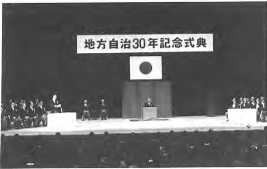
国立劇場で行われた記念式典