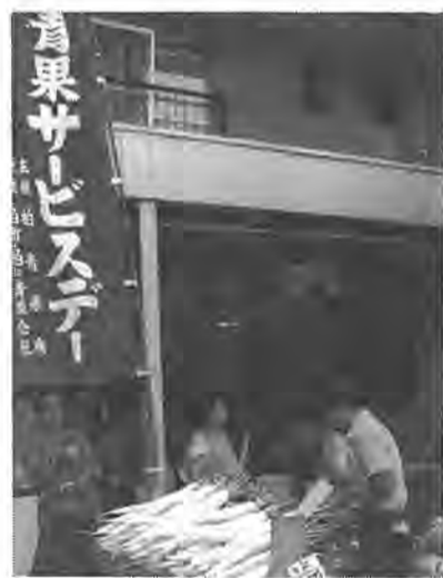
サービステーには消費者が一目でわかるノボリが店頭

肉類、魚貝類、野菜類を市価より安く提供し、消費者にサービステーようと設けられたもの。当初、市民にわかりやすくノボリやサービステーを利用してほしいかがどうか。 サービステーは、今までどおり魚貝類が毎月第一、第三水曜日、青果が第二水曜日、肉類が毎月二十九日に行われています。 ぜひ、あなたもこのサービステーをご利用してはいかがでしょうか。