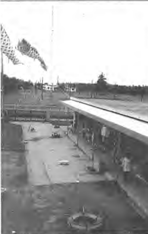
精神薄弱児の通園施設、十余二学園(写真)。児 新しい制度の発足で、ここに通園している見 児童の保護者に対しては、負担金の2分の1が助 成されることになりました