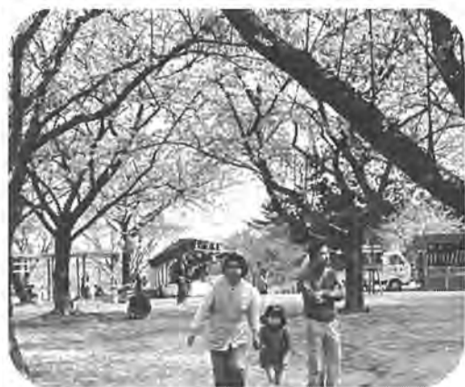
身近な春を柏の桜で(あけぼの山・昨年4月撮影)

「春は花、夏はととぎす…」桜見物に格好の季節になりました。例年になくきびしい寒さで、開花が遅れていた市内の桜も三月に入つてのポカポカ陽気で、順調な花便り。三日から十日あたりが見頃となりそうです。 上野や清水公園もいけれど、市内で手軽に楽しめる「花見」はないか。そんな人たちに、市内の「桜の名所」をご紹介します。