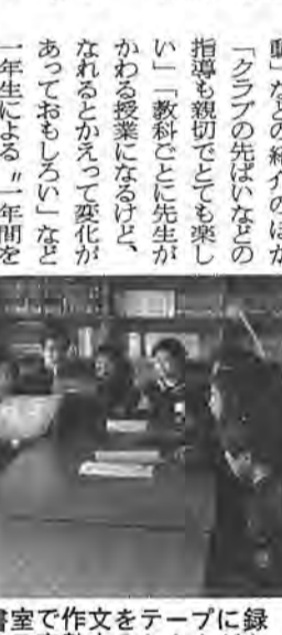
録音テープに「おもち」の声を録音する富勢中