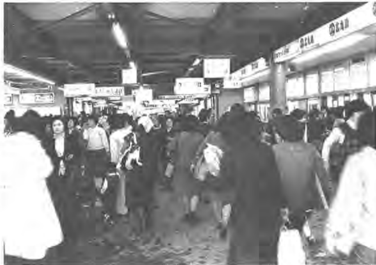
自由通路の柏駅舎内での混雑利用客

市では、混雑のひどい常磐線柏駅自由通路の拡張を三年前から国鉄当局へ働きかけていたが、このほど国鉄側から、利用客サービスの一環として、五十二年度中に現在の駅事務室を丸井ビル側に移転し、その跡にキップ発売機を増設したい、という連絡がありました。このことは、事実上の自由通路拡張を意味するもので、すでに飽和状態にある通路は、これによって歩行者の流れもスムーズになり、混雑の緩和が図られることになりました。