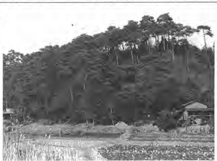
市内に残されたこうした貴重な“みどり”を保護するための「みどりを守る基金条例」も審議されています

▽みどりを守る基金条例の制定 昭和四十八年に「みどりを守り育てる条例」が制定され、みどりの保護を行ってきた。これをさらに推進するため、みどりの保護地区の所有者から申し出があった場合、必要に応じてこれを買い取ることをできるように、基金制度を設けるもの。