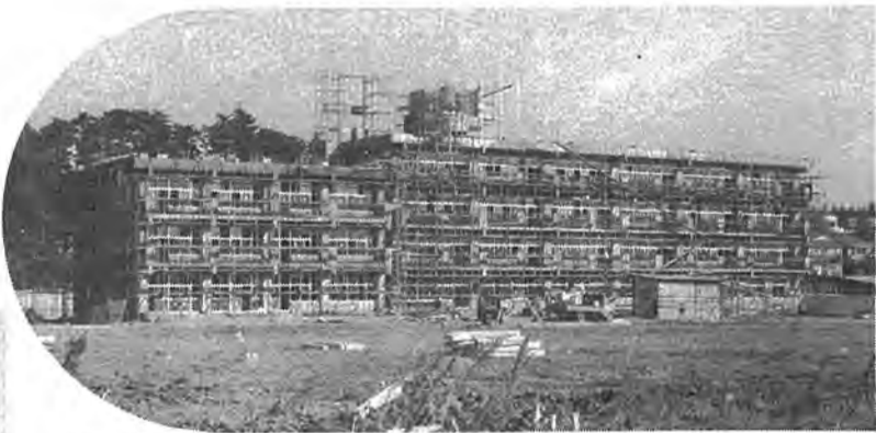
柏中の分離校として市内10校目の中学校として開校する柏五中(高田919-1)。普通教室18、特別教室7。建物の延べ面積は3,523平方メートル。生徒数392人で10学級が予定されています。用地費を含めた総工費は、8億5,000万円。敷地面積は2万659平方メートル。

市民の健康を管理するため、工費1億9,470万円を投じ、市民体育館に併設して建設していた柏市保健センターの一部に市と医師会が共同で「柏市急病センター」を4月中旬ごろ開設し、日曜休日の夜の第一次急病診療(内科・小児科)が始まります。一方、歯科についても歯科医師会による日曜・休日の急患診療が行われることになっています。(下の写真右の建物、左は体育館)