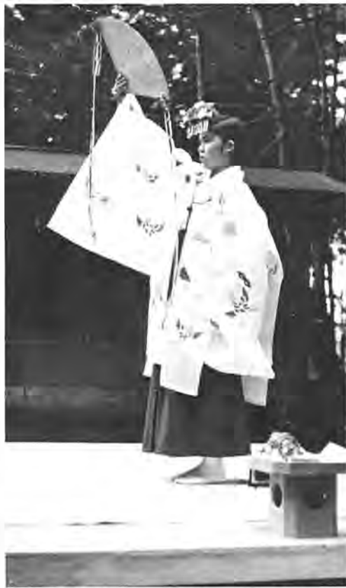
元旦と10月15日の年2回だけ奉納される浦安の舞

古式にのっとった、みやびやかな舞の舞で新春を祝う。浦安の舞は、おごそかな神事として近郊の人達の人を集めています。 五岩立彦彦宮司の境内で行われる元旦祭でのハイライト、浦安の舞は、おごそかな神事として近郊の人達の人を集めています。創建された、という由緒あるお宮