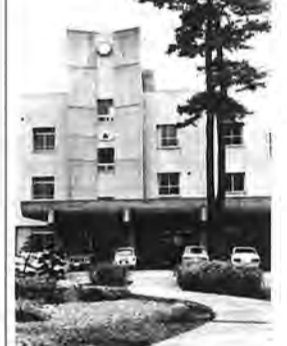
東葛飾高校の歴史を刻んできた。昭和四年第一回卒業式。今日

東葛飾高校（全日制）は、制服制度の廃止の発行段階に入つてから五年たった。当初生活指導上の問題を懸念する向きもあったが、いまその心配はない。生徒の学習意欲はさう盛んで、ほとんどの生徒が大学に進学している。また、きびしい受験競争の中でクラブ活動も盛んである。