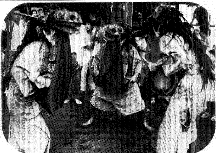
昔、埼玉のある村から雨乞いをたのまれたこともある獅子舞。その知名度はかなり高かったようです

ひよっこ(猿面・兎面)、四人の花等持、二人の金棒引き、断子方となり、踊りの手振り、断子の調子、断子ことばなどは、すべて