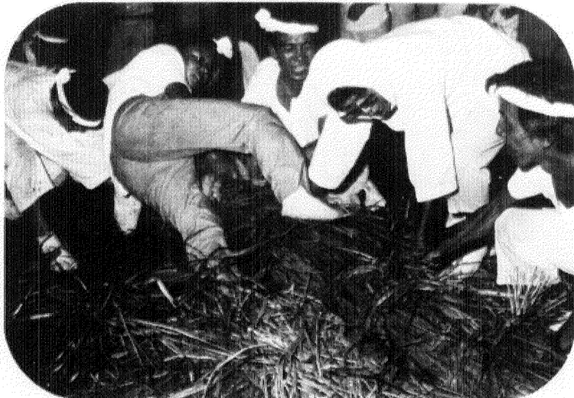
盆綱は、昔はその年の吉凶を占うものだけに、相手に負けまいと真剣なものでしたが、今では部落の楽しい夏祭りとなっています

夏。日本各地で祭りの便りが聞かれますが、柏市にも古くから里人によってつちかわれてきた郷土芸能があります。地方色豊かな雨乞いの舞『篠籠田の三匹獅子舞』豊作を占うユニークな祭り『大室の盆綱引き』のふたつがそれです。両方とも一時は後継者難で開催が危ぶまれた時もありましたが、その後の地元の人たちの暖かい手によって存続され、今年も「夏祭りの情緒」をたっぷり味わせてくれることになりました。