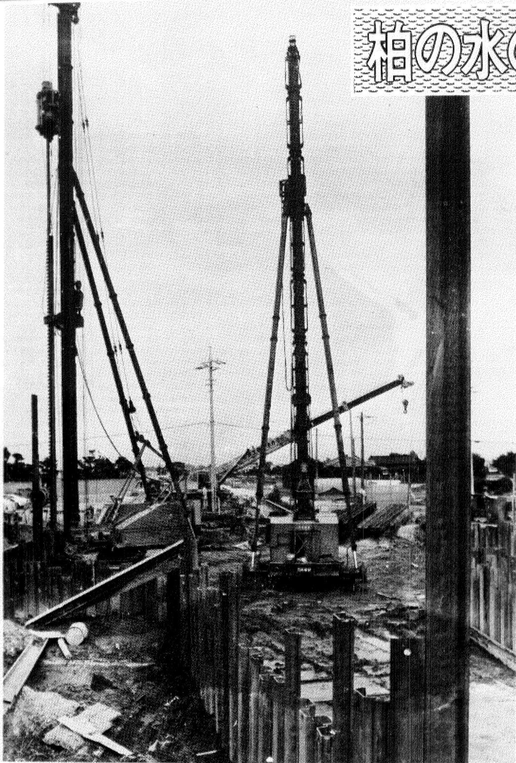
松戸市内の江戸川左岸では大規模な取水場の建設が進められています

浄水場では、沈澱、ろ過、滅菌などの必要処理を行い、一層きれいな水にして、各構成団体へ五台の圧送ポンプで送水されます。浄水場は三十四万一千平方メートルという広大な敷地をもち、全国でも規模、内容とも有数なものとか。ここでも工事は急ピッチで進められています。これに関連し、市内では送水管の埋設工事や急ピッチ(十数ヶ所)で進められています。