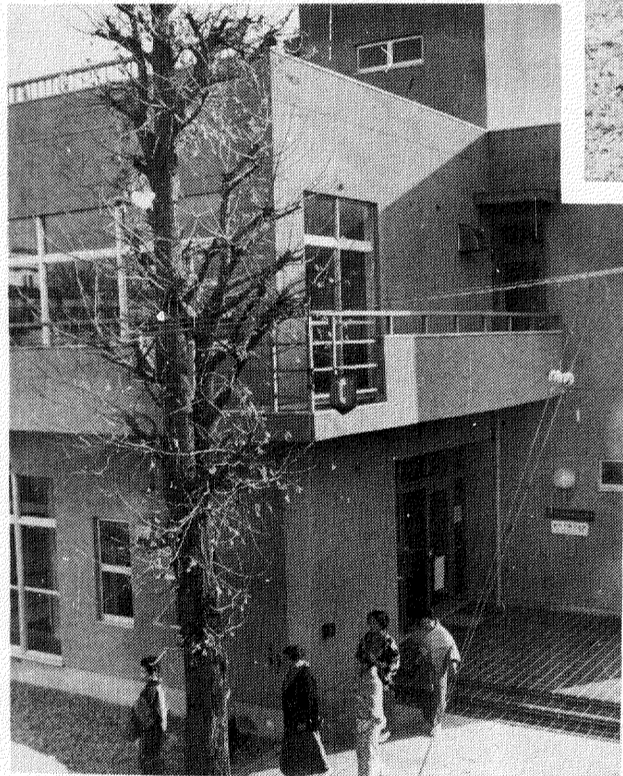
地域住民のコミュニケーションの場として、千代田近隣センターに次いで4月にオープンした「旭町近隣センター」。会議室や講座室、お年寄り向けの談話室や娯楽室などが設けられ、市民相互の気軽な交流やいこいの施設として広く利用されています。

一般会計補正予算は、千八百三十八万七千円が補正され、今年度の一般会計予算は、六百六十五億六千六百八十九万三千円になります。主な内容は、小中学校のプレハブ教室賃借料として六千三百三十二万円。酒井根小分譲校の備品整備に二千円を