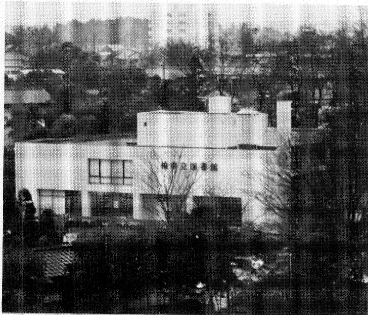
市制20周年を記念して、市役所南側に建設していた市立図書館は、このほど完成し、来春3月の開館を待つばかりとなりました。こんどできた図書館は、将来の人口増を見込んで、ゆったりとつくられており「郷土資料室」や、レコードなどを貸し出す「視聴覚ライブラリー」も備えています。