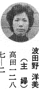
高田 一二八 七二一

水道料金の集金は、事前に通知されますが、当日やむをえぬ事情で家を留守にする事もあります。このような場合、料金の支払いに不便を感じています。