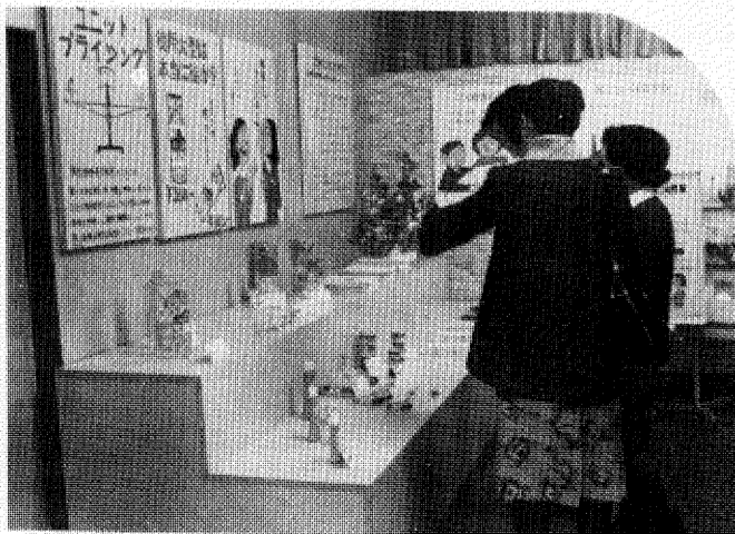
市民の消費生活向上の総合的な窓口として、柏駅東口のファミリーかしわ3階に開設した「消費生活センター」。買い物帰りなどにだれでも手軽に利用できる施設で、週1回の消費生活相談や商品知識を身につけていただくためのパネル展示のほか、内部には、食品添加物のテストもできる「商品テスト室」も設けられています。