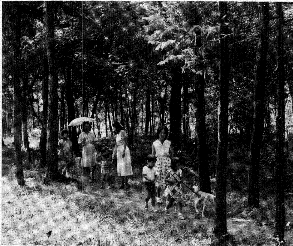
みどりの自然の中で、散歩や昆虫採集など自由にいこいのひと時を過ごしていただこうと、つくしが丘にオープンした柏で最初の「みどりの広場」。およそ5万平方メートルの山林は、回りを住宅街に囲まれています。マツやスギなどが生い茂り、自然との触れ合いに格好の場所です。

一九七五年もあと半月。この一年、不況が長期化するという、きびしい経済情勢のもと、柏市もかつてない財政難にみまわれ、経費削減をしいられてきたが、市民一人一人が快過で潤いのある暮らしを送れるようにと「福祉」に積極的な力を注ぎ、市民生活に身近な事業が数多くなされてきました。即ち、社会情勢の変化や、多様化する市民の要求にこたえて、「消費生活センター」や地域住民の交流の場である「旭町近隣センター」のオープン。さらに、自然に親しんでもらおうと「みどりの広場」(つくしが丘)の開場など、キメの細かい施策が次々に行われてきました。一方、引き続き人口の増加に対応して、保育園や小学校、高校、出張所などが新設され、市民生活に深く関連した施設の整備が着実に進められた年でもありました。今号では、こうした二年間の市政をふりかえり、その足跡を写真でみることにしました。