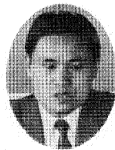
客さま 客さま 客さま 客さま 客さま 客さま