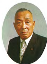
柏市長 山澤諒太郎

市民の皆さま、あけましておめでとございます。戦後かつてない激動の年といわれた、昭和四十九年が過ぎ去りましたが、本年も引き続きわが国とわがまち(柏)をとりまく環境は、景気の不透明さも加わって、その情勢は一段と厳しさを増しております。このような経済情勢にかんがみ、行政運営については、経済の変動に対応できるよう、弾力的に対処いたす考えでありますが、一方こうした時にこそ市民福祉に密着した、地方自治体の真価が問