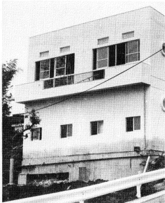
近くの清掃工場の余熱を利用した大浴場も備えた近代的な柏寿荘