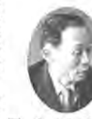
鈴木 再開発の記事では、丸井のビルということについて

鈴木 再開発の記事では、丸井のビルということについて、広報紙ではわかりません。私企業については別だとい