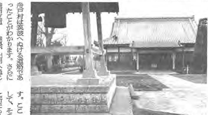
水海道、筑波への道筋にたつ現在の船戸の医王寺

柏の市章の由来を「ご存じですか。市章は、昭和二十九年の柏市制施行時に一般から公募したもので、ひらがなの「か」「し」「わ」の三文字を組み合わせたものです。報道されています。