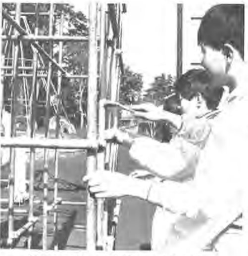
後輩が気持ちよく使えるようにとペンキ塗りする五小のお友だち

六年間ありがとう 五小の卒業生ペンキ塗り 柏五小の六年生は三月十九日の卒業を前に、今まで使ってきたジャンケルジムや鉄棒、平均台などをきれいにしようと、毎