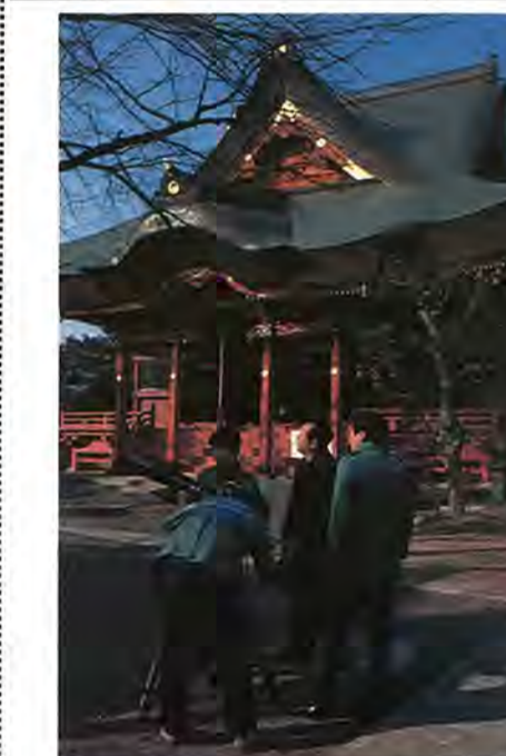
柏の古い昔をたずね、そして未来への展望を描く市政広報映画。撮影は「毎日映画社」の手によりいま快調に進められています。完成はことし7月の予定で、視聴覚ライブラリーや広報広聴課を通じて、一般市民のかたに利用してもらいます。

市役所地下売店販売している市指定の様式のものでお願いします。なお工事と資材・物品とは別冊で提出してください。