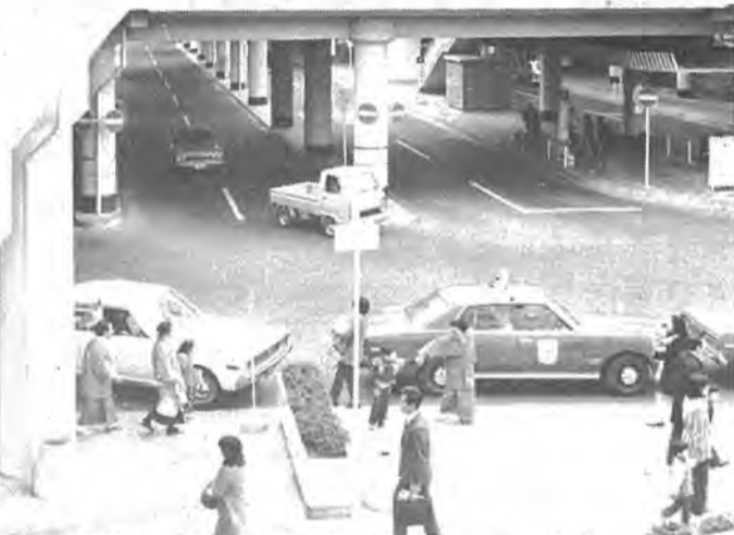
10月6日、市勢発展の基礎造りといえる、柏駅前再開発がついに完成。「新しい時代」への第一歩を踏み出しました。