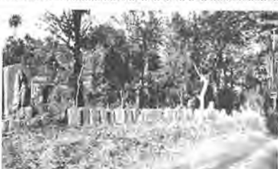
南増尾の県道沿いに並ぶ百庚申

いなか道を歩いてみると、風化しきつて立っているさまさまな石塔や石像をあちらこちらに見つけます。これらの大部分は江戸時代につくられたもので、当時の庶民の信仰の様子を知る貴重な資料になります。その中に庚申塔(こうしんとう)と呼ばれるものがあります。庚申・猿田彦などの文字や梵字・青面金剛(しょうめんこんごう)像などを彫刻したもので、市内でおおよそ七百基の庚申塔が確認されています。庚申信仰は中国の古い民間信仰から生まれたもので、日本には平安時代に伝わったと言われています。「人間の体内には三尸虫(さんしちゅう)と言う虫が宿っていて、それは六十日ごととに回ってくる庚申(かのえささ)の日の夜、人間が眠っている間に体内を脱けだす」と考えられ「その三尸虫によって天の神に悪業を告げられた人は、その身に災難がふりかかるともあるいは命を縮める」とも考えられていました。これらの災からのがれたいという気持ちから、宮中や貴族の間、身を慎み清