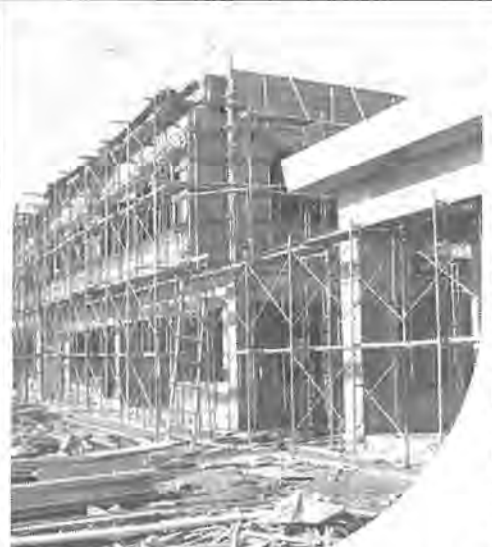
南向きの広い敷地に建設中の豊住保育園

こうした収集区域を常磐線を境に東・西二つに分けたブロック編成にして市民サービスの向上を図ることに、問題のキャップを少しゆるめようとするものです。 常磐線境の区域割 東側は月・水・金 西側は火・木・土 新しい収集は、別図のとおり区域と西側区域に分け、東側は月・水・金、西側は火・木・土の収集日となります。