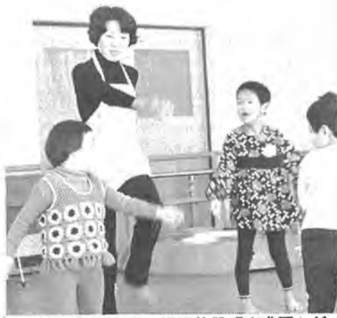
体の不自由な子の通園施設「育成園」が4月に完成。現在19人が社会復帰に必要な機能回復訓練に励んでいます。

昭和51年3月完成を目ざす、北柏駅南口土地画整理事業は、2月に本格的な埋立工事に着手。現在、整地工事と下水道管埋設工事が進められています。