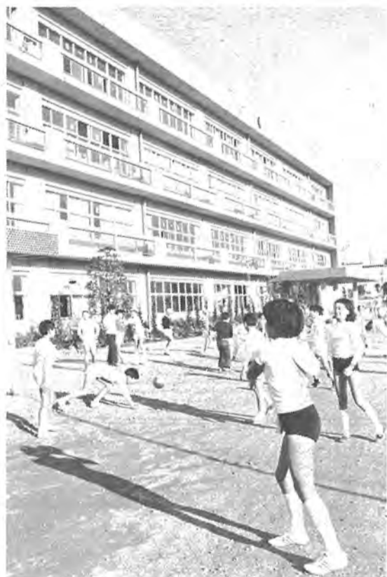
学校建設では、新しく旭小と四中が4月に開校。その他小学校へのプールの建設など、急増する児童生徒の積極的な対策と教育施設の改善に努力しました。