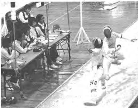
十月には、「若潮国体」が開催され、柏市はフェンシング会場となり、全国から二百六十名の選手が来柏し、熱戦が展開されました