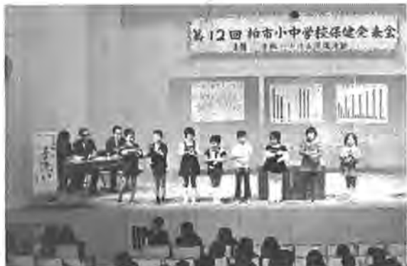
レコードに合わせて手洗い体操をする土南部小のおともたち

で開かれました。この発表会は小中学生が日ごろの自主的な保健活動の成果を、お互いに発表