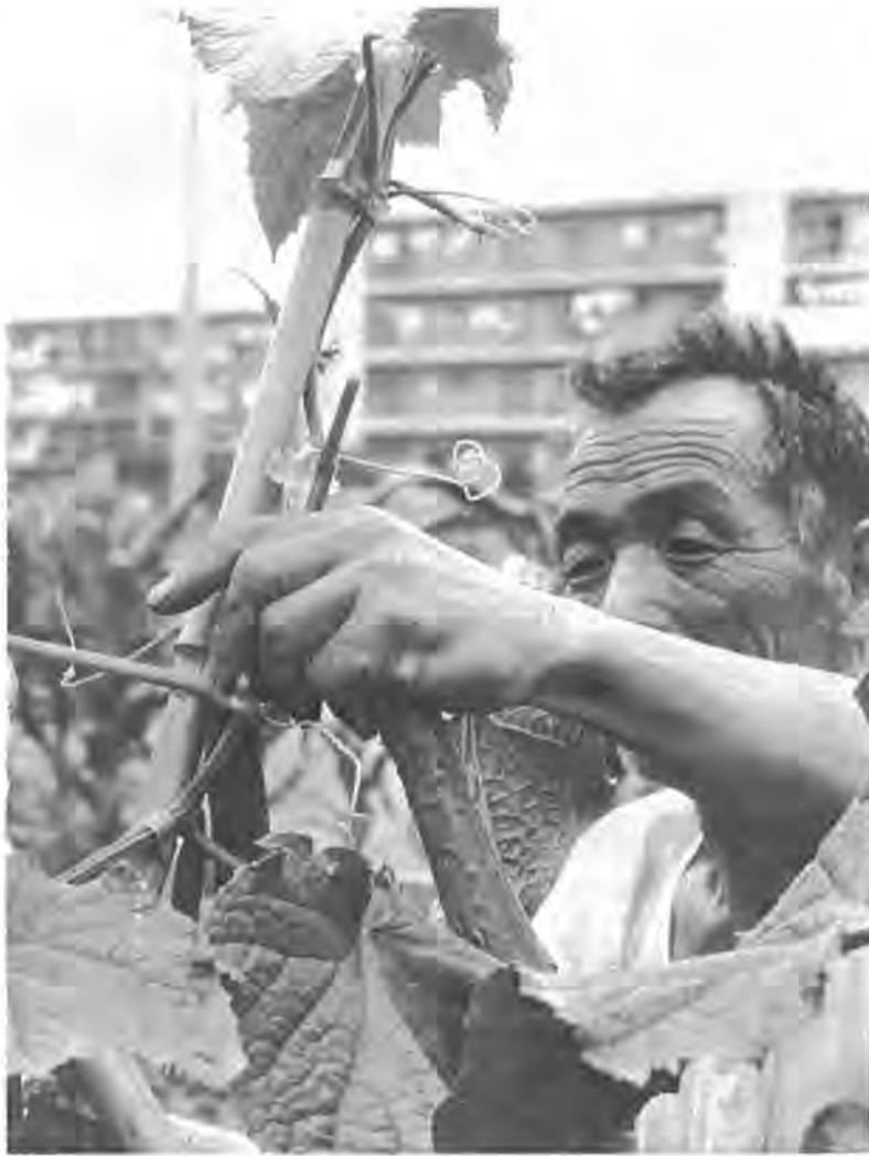
キュウリの取り入れに忙しい農家。だが隣接農地は日ごとに住宅地になってゆく。首都近郊都市「柏」の姿がここにもある。=7月10日市内豊四季で

昭和四十六年度の粗生産額三十八億二千八百万円のうち七十・六％(二億五千九百四十四万円)を占めています。今後も野菜の需要増からこの傾向は続くものと思われま