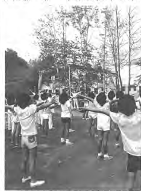
菅平の朝、すがすがしい空気を胸いっぱい吸って元気にラジオ体操

菅平高原に近代的な「菅平かしわ荘」がオープンしたのは去年の十二月。はや七月半が過ぎました。以来スキーに、ハイキングに山菜取りにと、六月末までに三千八百人の市民が利用しました。