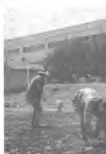
ほこりの防止とみどりの 環境造りに役立つ芝張り

校庭に芝張り 柏中 県下で初めて 柏中では、県下に先がけ芝張り作業を始めました。これは校庭に、根つきがよく