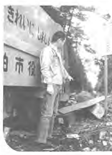
天狗党にねらわれた吉田家

寛永年間（一六四四～一七〇四）に打ち出された徳川幕府の鎮国政策は、その後ますます強化され、これが幕府をゆるぎのないものとするに役立ったのです。 その後先遣隊では、通商貿易がさかんに行なわれるようになり、ひとり日本だけが諸外国と