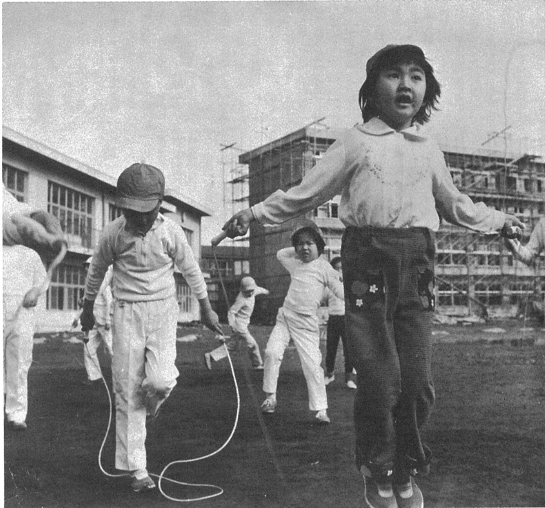
プラ校舎さよなら

のが現状です。これらの建築は年次計画に基づいて行なっていますが、このなかには市制二十周年記念事業として皆さんの健康と体力づくりを促す市民体育館の建設も含まれています。現在、計画は予定通り進められ一部は完成して利用されている施設もあります。