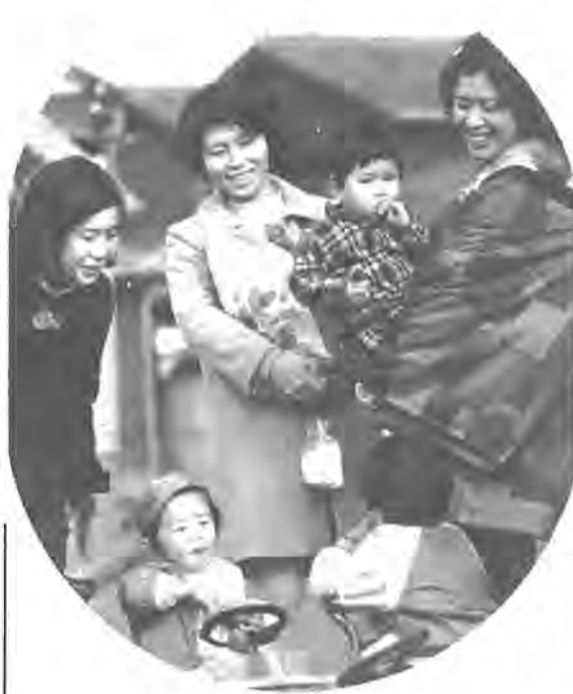
税金は明るく豊かな市民生活を築くために使われます

この法人市税額は、均等割と所得の法人税額をもとにする法人税額からなっています。均等割は、